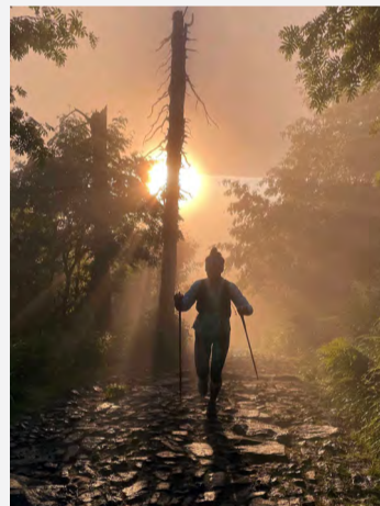
Noční přechod Beskyd.

Dodává, že až děti zase trošku odrostou, potrénuje opět na horské ultra. Pokud jí to zdraví dovolí, chce na některý ze závodů v rámci Grossglockner Ultra Trail či Ultra Trail du Mont Blanc. Jesenícký maraton a Zapomenuté hory jsou podle ní jisté!