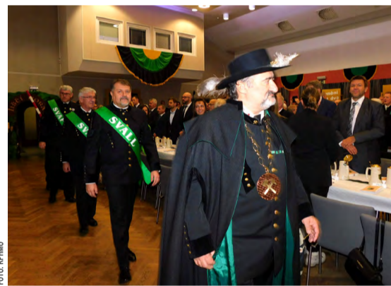
Prezidium na IX. Skoku přes kůži.