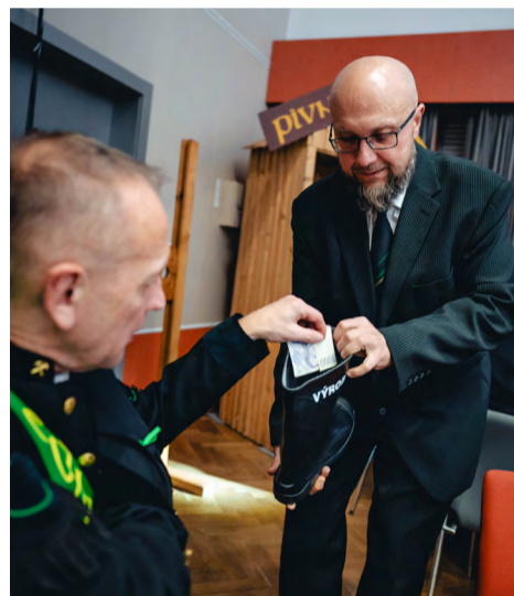
Tradiční sbírka do gumáku na Barborku.