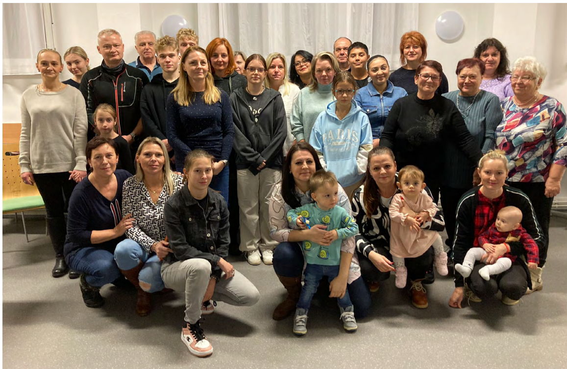
Barborkovského setkání se zúčastnily už i děti původních hornických sirotků.