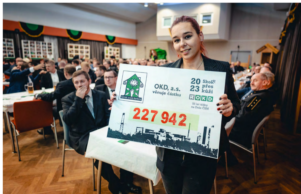
Na sirotky z Barborky se opět vybrala slušná suma.