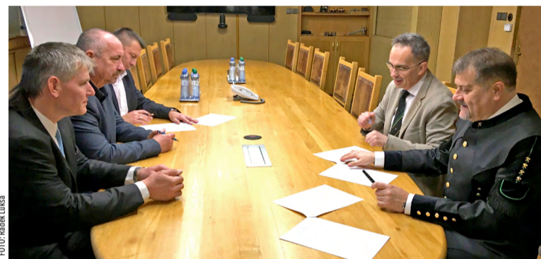
Podpis kolektivní smlouvy OKD.

„V letošním roce dosahujeme pomocí programů na snížení úrazovosti lepších výsledků. Motivaci zaměstnanců v oblasti bezpečnosti při práci ale chce-