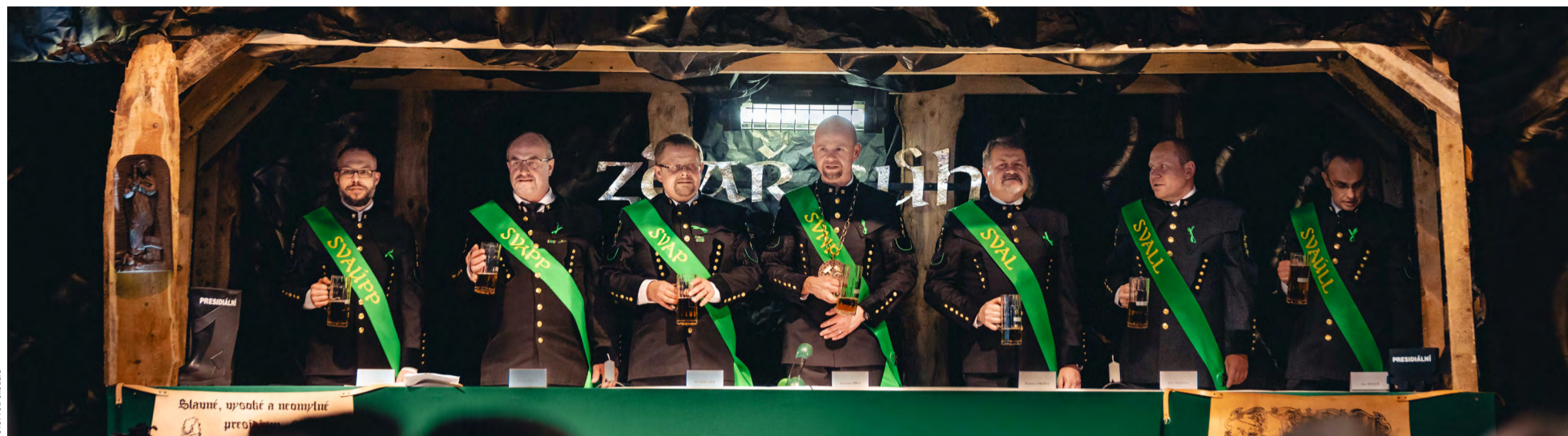
Prezidium na slavné sessi OKD ve Stonavě.