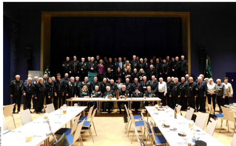
Klubová Barborka KPHMO v Petřkovících.