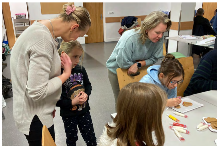
Vánoce se blíží, zdobení perníčků nesmělo chybět.

Barborka přispívá hlavně na vzdělání, volnočasové aktivity, školní potřeby, tábory, autoškolu, výpočetní techniku nebo na zdravotní aktivity. Vloni byly děti podpořeny celkovou částkou přes milion korun, kdy největší část byla získána formou darů od štědrých dárců, z grantu Nadace OKD a příspěvků členů spolku.