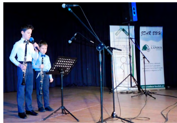
Hudební vložka pro bývalé havíře z Františka.