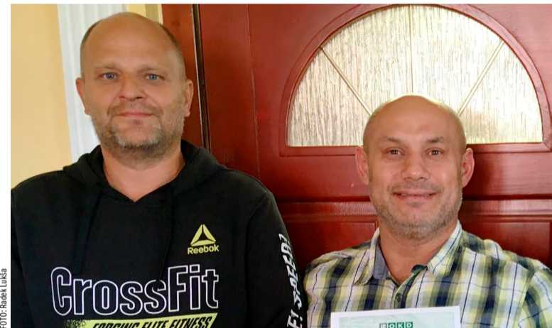
Vedoucí úseku s hlavním předákem.