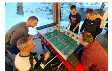
Po výletu venku došlo na hry uvnitř.