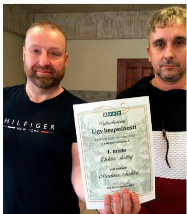
Elektroslužby vítězové kategorie A.