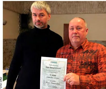
Centrální údržba bojovala až do konce.