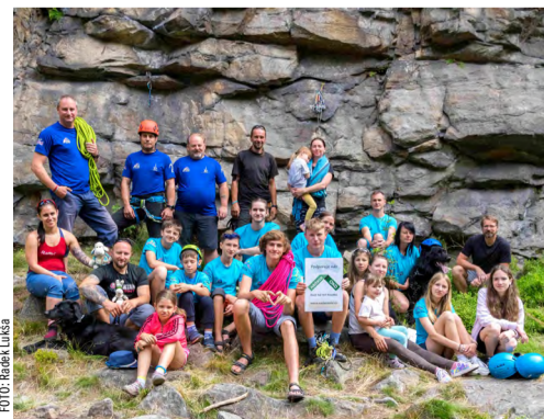
Beskyd Karviná ukazuje v horách, kdo je jeho partnerem.

smlouvaný dvě základní školy, kam ji, až se oteplí, přivezou a nechají na ní žáky cvičit. „Čekáme, že se ozvou ještě další školy a mateřské školký. Pro ty malé děti se ale bude hodit jen boulderová stěna,“ popisuje Vrána.