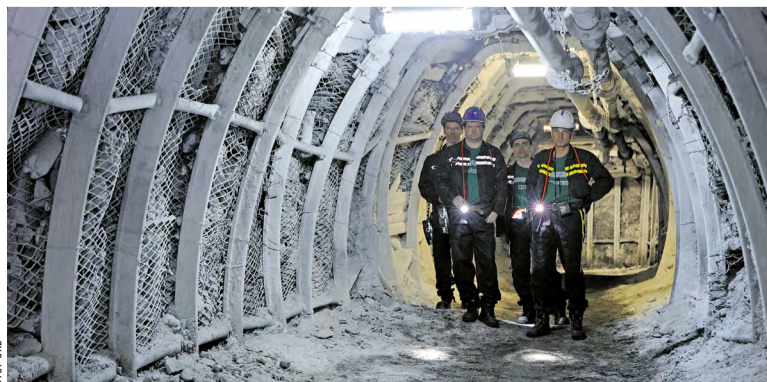
Nabídka pro nové příchozí je zajímavá.

Informace k náboru zaměstnanců mohou zájemci získat v Poradenském centru OKD v Karvině a na webu pracevokd.cz.