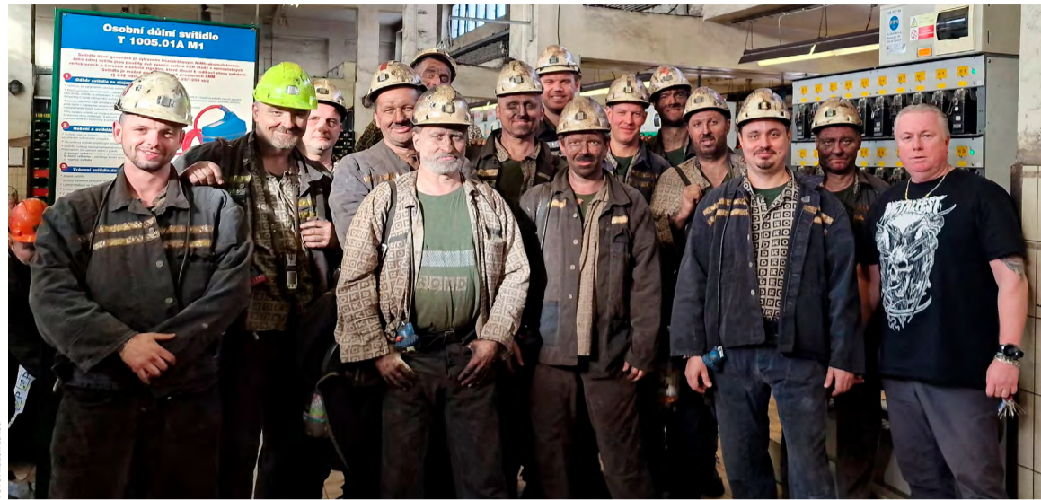
Razičí kolektivu hlavního předáka Marka Noworyty.