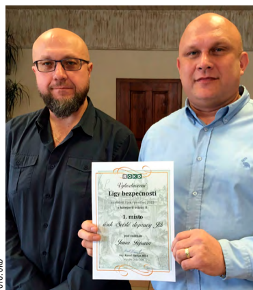
Svislá doprava výherci kategorie B.