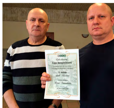
Nejbezpečnější vybavování a likvidace.

Zdůraznil, že v bezpečnostní kampaň pro rok 2024 je vyšší šance dosáhnout na odměny, protože vyhlášení výsledků bude probíhat měsíčně, nikoliv kvartálně, a též díky zahrnutí příplatků za bezúrazovou práci.