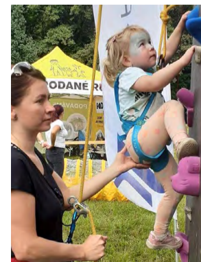
Vlastní lezecká stěna měla premiéru na hornickém dni.

Zimní sezonu tráví horolezci z Beskydu lezením uvnitř (v Ostravě, Bohumíně, Těrlicku), ale jakmile to počasí dovolí, chystají se na venkovní stěnu do Havířova. Za sebou i před sebou mají výpravy do Beskyd,