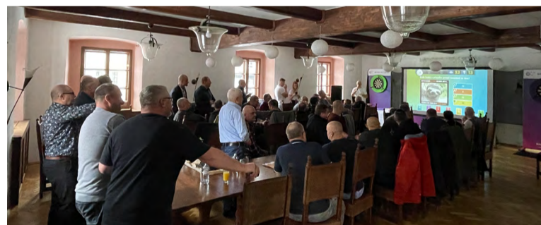
Hromadný vědomostní kvíz.