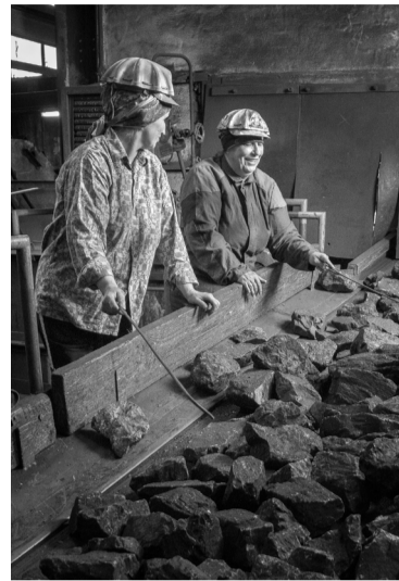
Úpravářky na Dole ČSM.

KARVINÁ – Bezmála osmdesát tisíc korun vynesl prodej charitativního kalendáře pro rok 2024 s názvem Zdař Bůh, jenž za podpory OKD vytvořil ostravský fotograf Boris Renner. Objevily se v něm scénérie ze starých šachet, z hornických oslav a tradičních akcí, ale také současných provozů Dolu ČSM, jako čelba či úpravna uhlí.