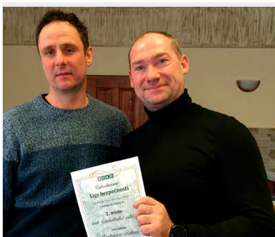
Centrální odtěžení uspělo v kategorii B.