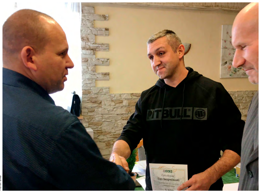
Nejbezpečnější v rubání.