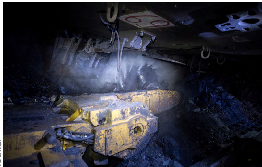
Stonavská šachta nakonec vloni vytěžila nad milion tun uhlí.

Výrobně-technický náměstek Petr Škorpič poznamenal, že milion tun ne-