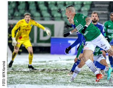
Poslední loňský zápas.

Tomu se také nelíbilo, že Karviná nevládala hrát dobře s přímými konkurenty: „Je hezké a fajn vyhrát v Plzni, porazit Liberec nebo bodovat v Mladé Boleslavi. Nam ale především chybí body z domácího utkání s Teplicemi a potom z Pardubic a Českých Budějovic. Tyto ztráty jsou