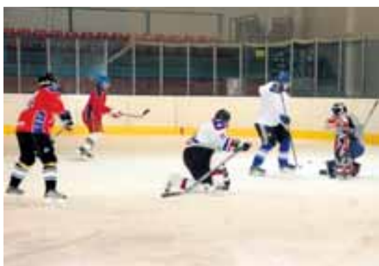
Hokejové bitvy rubáňových z Dolu Paskov a „ostatních“.