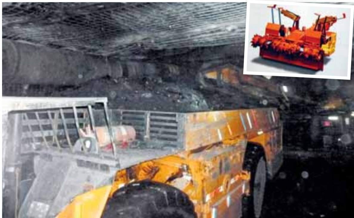
V popředí přepravník Shuttle Car, do něhož se sype rubanina z dobývacího kombajnu. Ve výřezu kombajn Bolter Miner.

„Rozdílů vůči nám známým technologiím je spousta. Neméně důležitou