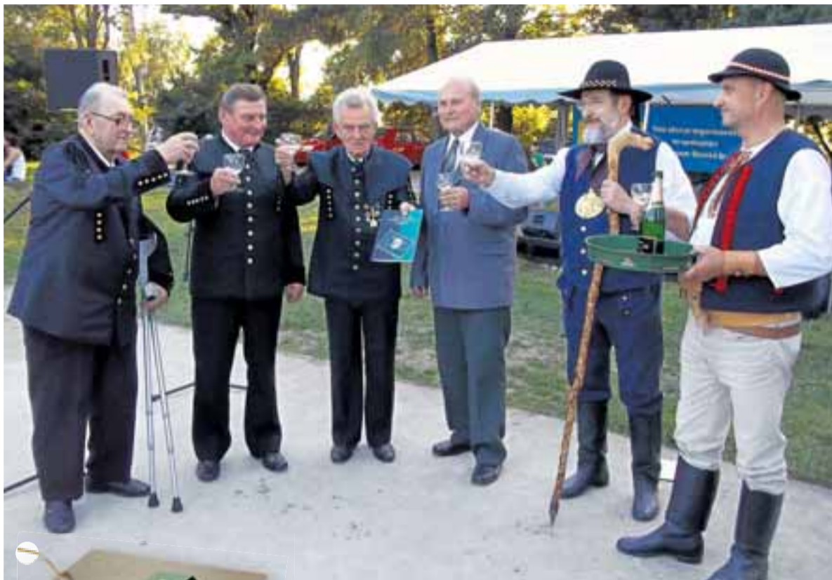
Zástupci Nadace Landek Ostrava při křtu publikace ke 110. výročí Hornického spolku Rozkvět Sedlišť. Na vydání knih a publikací věnovala nadace loni celkem 575 tisíc korun.

Rovných 100 tisíc korun nadace věnovala například na vydání Stavovského hornického kalendáře Těžní věže 2012, stejnou částkou podpořila vydání knihy Počátky hornictví v Ostravě. Pětapadesát tisíc spolufinancovala přípravu publikace ke 110. výročí vzniku nejstaršího hornického spolku v regionu – Hornického spolku Rozkvět v Sedlišťích, třiceti tisíci korun publikaci věnovanou 50. výro-