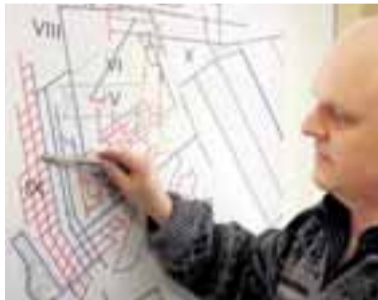
Jiří Korbel ukazuje budoucí pilíře.

částí přípravy nové dobývací metody bude dořešení zajištění jejího bezpečného provozu a rovněž legislativních