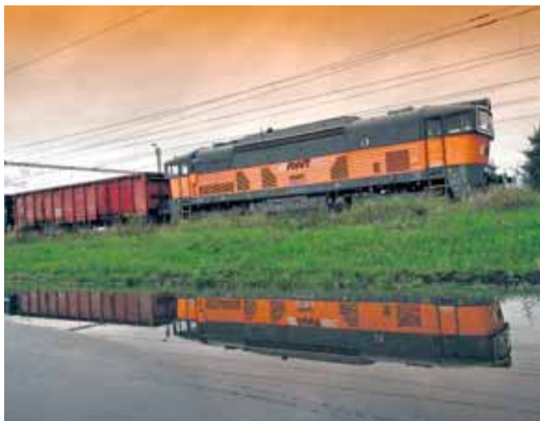
Společnost AWT přepravuje zboží, mezi jiným uhlí a koks, na stále větší vzdálenosti.

„Naši doménou byla vždycky železnice a uvedené čísla to jen potvrzují. Hodnoty dosažené v loňském roce naznačují, že je AWT stabilní firmou nejen s pevným postavením na domácím dopravním trhu, ale také s rostoucími úspěchy na trzích mezinárodních,“ zdůraz-