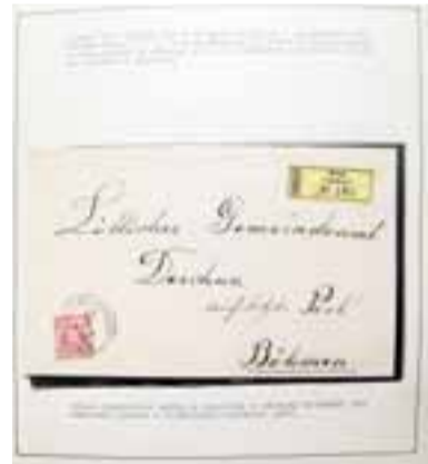
Reprofoto doporučeného dopisu ze sklonku 19. století, označeného R nálepkou vytištěnou pro zkušební provoz u vídeňských státních pošt.

Uzávěrka je v úterý 21. února 2012. Texty pošlete poštou na adresu redakce: Týdeník Horník, Prokešovo nám. 6, 702 00 Ostrava, faxem na tel. číslo 596 113 648 nebo e-mail: renata.pavlikova@okd.cz. Zasláný text označte SOUTĚŽ. Nezapomeňte připsat své jméno, adresu, případně telefonní číslo. Výherci si mohou odměnu vyzvednout po předchozí telefonické domluvě s Renatou Pavlíkovou na čísle 732 829 149, nejpozději však do 10. dne následujícího měsíce. Pokud tak neučiní, výhra propadá. Jména výherců soutěžní fotografie č. 7 zveřejníme v dalším čísle novin.