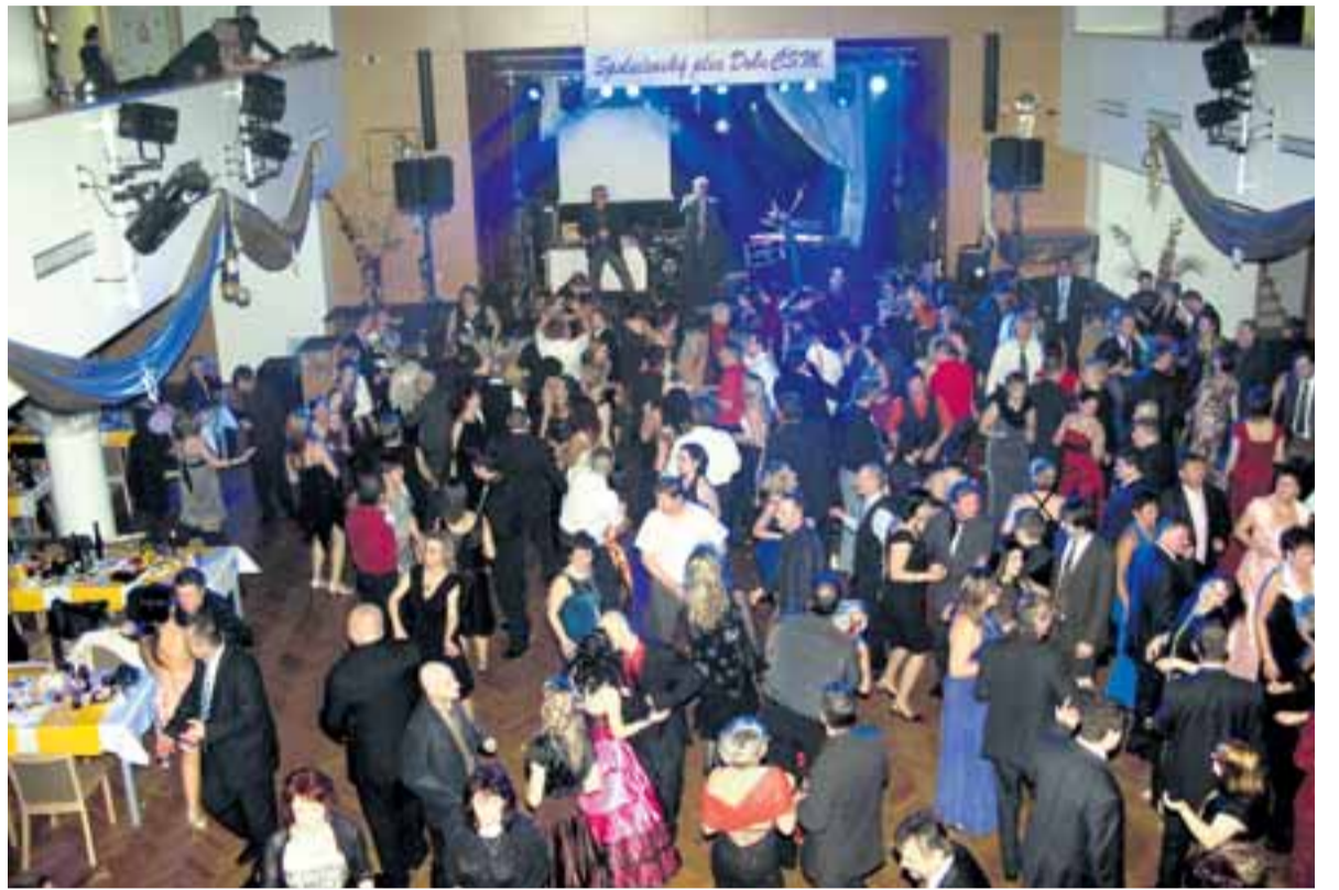
Zaměstnanci šachty, jejich příbuzní a přátelé se bavili i dlouho po půlnoci.

Když přicházeli na scénu hlavní hosté večera Miloš Pokorný a Roman Ondráček, známí spíše jako duo Těžkej Pokondr, byla už neděle. Nicméně ani po jejich koncertě se domů nešlo, bal Dolu ČSM končil nad ránem. uzi