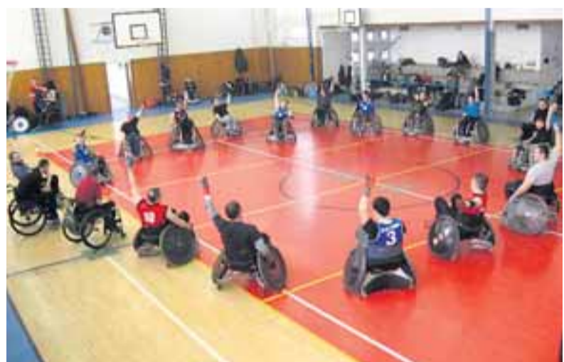
Koníci se společně se třemi polskými týmy připravovali na společném tréninku.

První kolo Mezinárodní slezské ligy ragby vozíčkářů se změnilo v soustředění