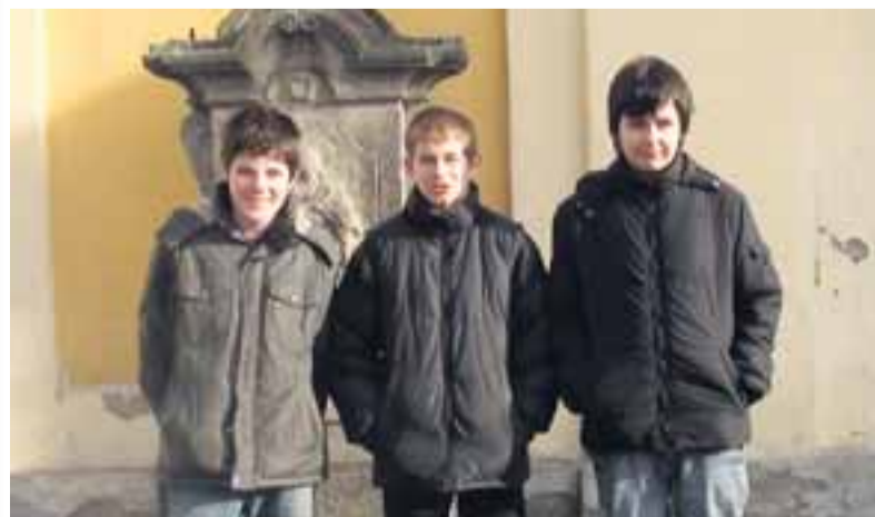
Mladí členové Bubliny pomáhají s přípravou historicko-kulturního dokumentu z jejich regionu.