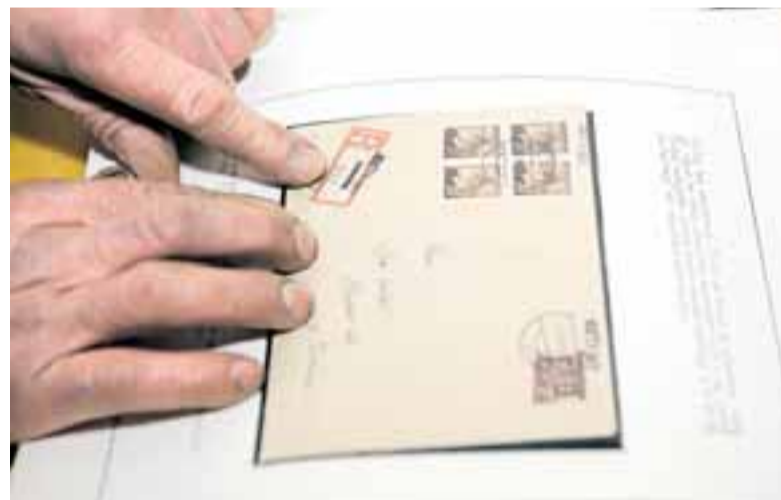
Doporučený dopis z poválečného období. Česky psané nálepky ještě chybí, proto je německý název obce Cetzviny (Zettwing) přeškrtnut a nahrazen razítkem.