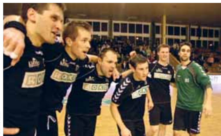
Házenkáři HCB OKD se radují. Vstup do druhé půlky sezony 2011/12 se jim povedl.