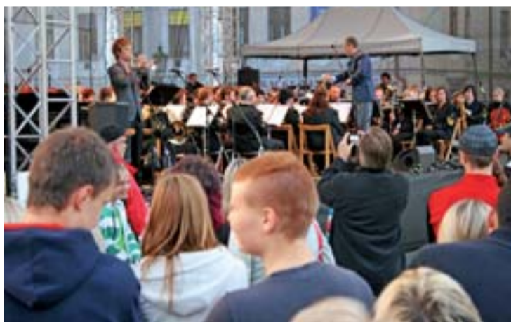
Wielka górnicza orkiestra dęta „Májováka” na scenie Dni Karwiny.

Fundacja OKD powstała w styczniu 2008 r. Od tej pory wydała na realizację prawie 800 projektów społecznych o wartości około 120 mln koron. Założycielem fundacji jest spółka węglowa OKD, która przekazuje na jej działalność corocznie 1 procent ze swego zysku. Kolejnymi donatorami fundacji są spółki NWR, RPG RE, Green Gas, OKD, „Doprava” i OKK „Koksovny”. bk