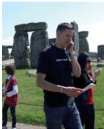
Stonehenge patří mezi oblíbené cíle turistů po jižní Anglii.

To může ukazovat na skutečnost, že firma nemá dostatečný cash flow. To samé platí i pro případy, že slevy na zájezdy v poslední minutě jsou v porovnání s trhem extrémně vysoké. Obvyklé jsou přitom slevy 10 až 20 procent.