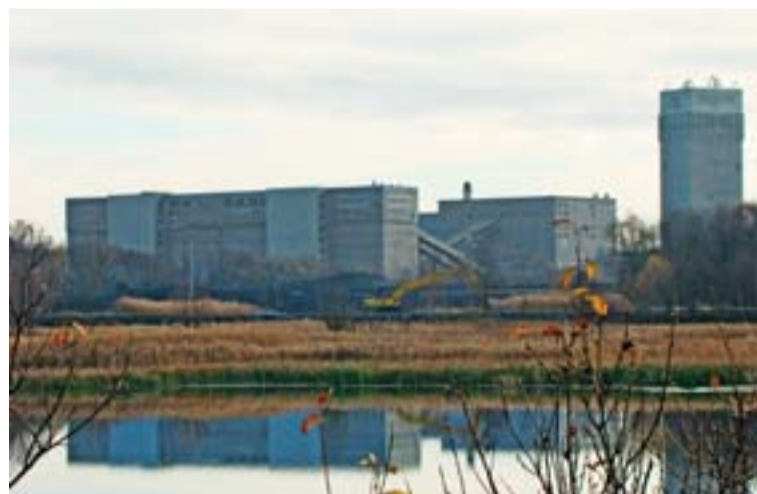
V popředí jsou kapacitní zásobníky surového i praného uhlí. Samotná úpravna je za zásobníky. Vedle zásobníku je budova odkamenění.

Komplex byl postaven jako dvoulinkový se dvěma nezávislými zpracovacími linkami pro selektivní úpravu uhlí vhodného pro koksování i energetické