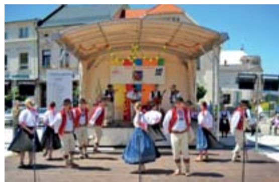
Fryštácké náměstí patřilo folkloru a lidové kultuře.