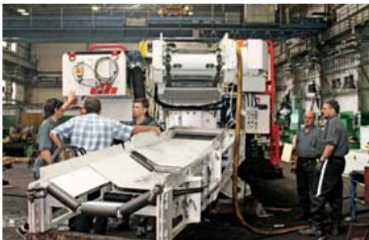
Kombajn dh R75, widok od tyłu.