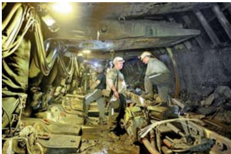
Vybavování porubu 320 209 překlizenými technologiemi z programu POP 2010.

Z pracoviště 320 312 na závodě Jih převáželi zaměstnanci provozu důlně technických služeb (DTS) podporubový dopravník PF 4 PZF 11 a trať porubového dopravníku PF 6. Na povrchu se musela provést oprava pohonných stanic druhého ze zařízení. Z pracoviště 331 203 na závodě Sever komplikované překlídli sekce Buc 1300/3100. Na překlíz bylo poprvé použito