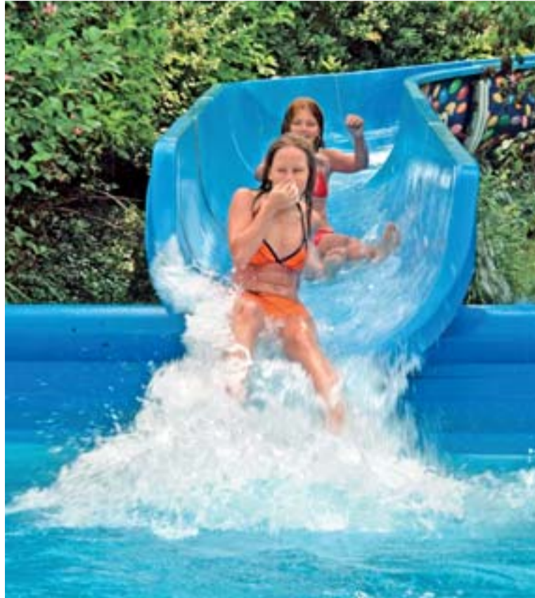
Voda patří k radostem léta.

Víte, že kromě hodin počítáme v desítkové soustavě? Desítka je rovněž číslo, které udává počet oblastí, ze kterých můžete volit při rozhodování o tom, jak uplatnit svoje flexi pasy a zvýšit tak například požitky z dovolené, komfort při čtení pořízením nových brýlí nebo příspěvku k osobní pohodě využitím některé ze služeb typu wellness.