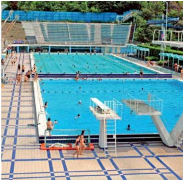
Dnešní aquaparky nabízejí nepřehledné množství atrakcí, ale přírodní areál je pro léto nejlepší.

Zaplatit si bazén – a tedy i možnost plavat v ideálních podmínkách, bez nebezpečí, které je spojené s plaváním v přírodě, v často neznámých vodách a většinou bez dozoru profesionálních plavčů – patří k jedné z možností jak využít Flexi Passy, které zaměstnanci OKD získávají právě v těchto dnech jako součást benefitů zaměstnavatele.