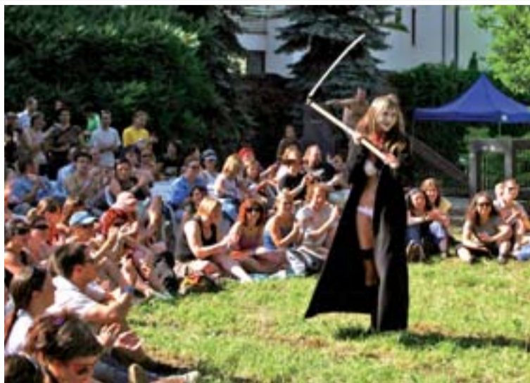
Divadlo je vždy zajímavou součástí festivalu, snímek je z předloňského ročníku.

Představí se i divadla, která spolupracovala s Nadací OKD. PaS de