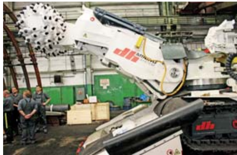
Przód kombajnu chodnikowego dh R75 firmy Deilmann-Haniel z organami urabiającymi.

Nowy 80-tonowy – z pełnym wyposażeniem – kombajn chodnikowy jest przeznaczony do pędzenia wyrobiska o dużych przekrojach, od K18 wzwyż. Długość maszyny sięga prawie 12 metrów, szerokość 4,4 m, wysokość 2,5 m. Maksymalny zakres wysokości urabiania wynosi 4,7 m, maksy-