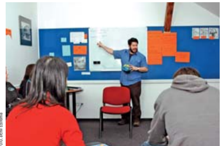
Kolik řečí umíš, tolikrát jsi člověkem – může pomoci i Flexi Pass.

Samozřejmě, že i jakýkoli kurz vedle v ulici v „jazykovce“ je důležitější než neučit se nic.