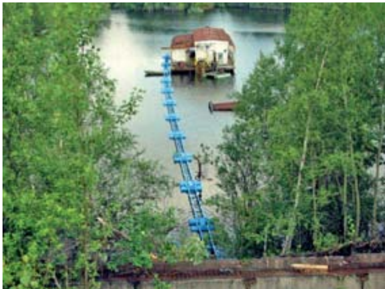
Ponton pro přívodní kabel k plovoucí čerpací stanici.