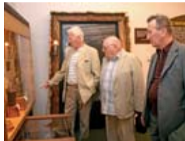
...a s kolegy z Klubu přátel Hornického muzea při prohlídce muzejních expozicí.

vyrazil z pověření mezinárodního společenství, byly Vietnam (1980 – 1983), kde pracoval jako ředitel dvou tzv. velkoškálových projektů FAO UN na zvelebení výzkumných ústavů lesnických v Hanoji a Hočiminově městě (Saigonu), a Laos (1986 – 1989), kde se věnoval školení obyvatelstva a zakládání agrolesnických