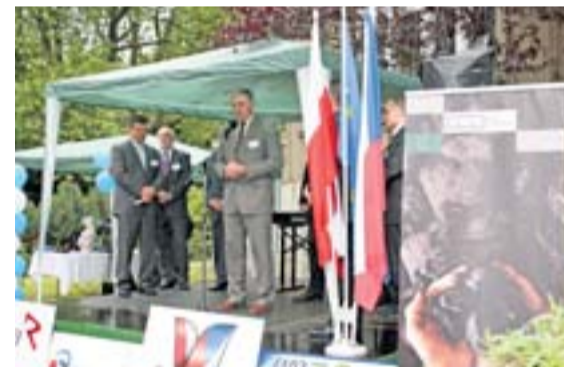
Čestnou scénu setkání podnikatelů lemovaly tabule s logy OKD a NWR.