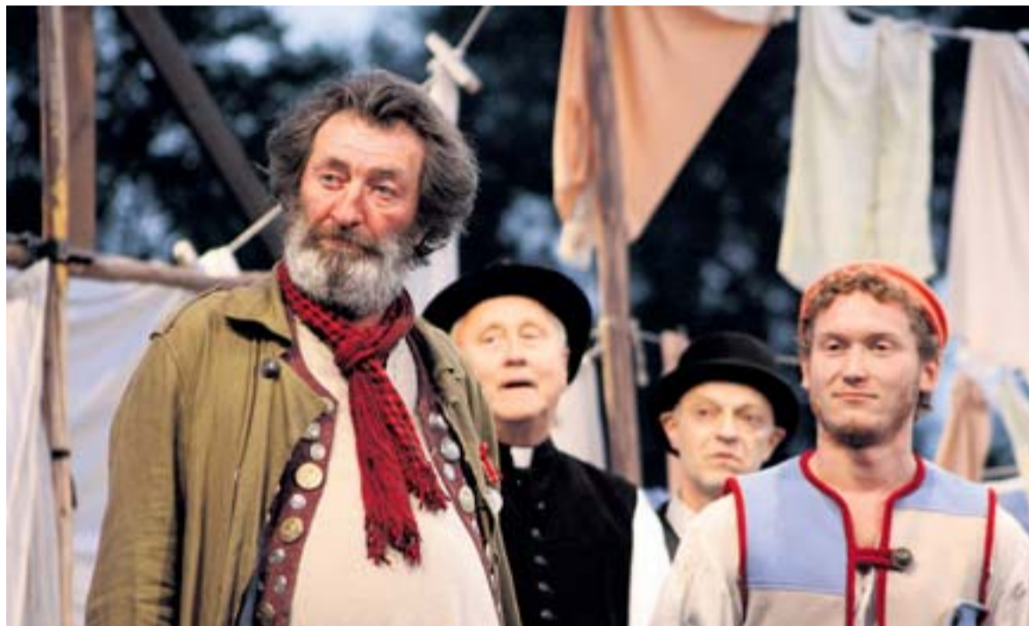
Na divadelní přehlídce na Slezskoostravském hradě nebude chybět ani slavný Bolek Polívka (vlevo).

Určitě ano! I obyčejného horníka anebo dělníka může Shakespeara tvorba oslovit. Je totiž opravdu nadčasová, a to se nemusíme bát jen o neznámější milostné zápletky v Romeovi a Julii. Shakespeare se zabývá nesmrtelnými tématy, která jsou aktuální v dnešní době: korupci, podlost v politice... Strašně moc jsme chtěli pro naše další představení na Shakespeareovském turné do Prahy, Brna a Bratislavy partnera, který je symbolem rozvoje našeho regionu. A to se nám s OKD podařilo! Ostatně, i pražští herci se sem těší, chystají se do Hornického muzea a někteří se by chtěli podívat na šachtu.