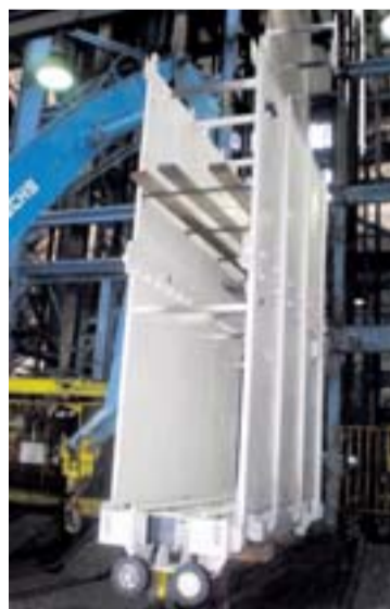
...budou v ní do dolu spouštět sekce v celku.

Dopravní nádobu vyráběla firma SE-MI ve spolupráci s podnikem Kadamo od února. Termín dodání na Chlebovice byl „šibeniční“ – konec dubna – nicméně splněný. „Pracovníci z úseku důlní dopravy navštěvovali výrobce a projednávali takové úpravy, aby nám dopravní nádoba co nejvíce vyhovovala. Musím vyzdvihnout hlavního předáka