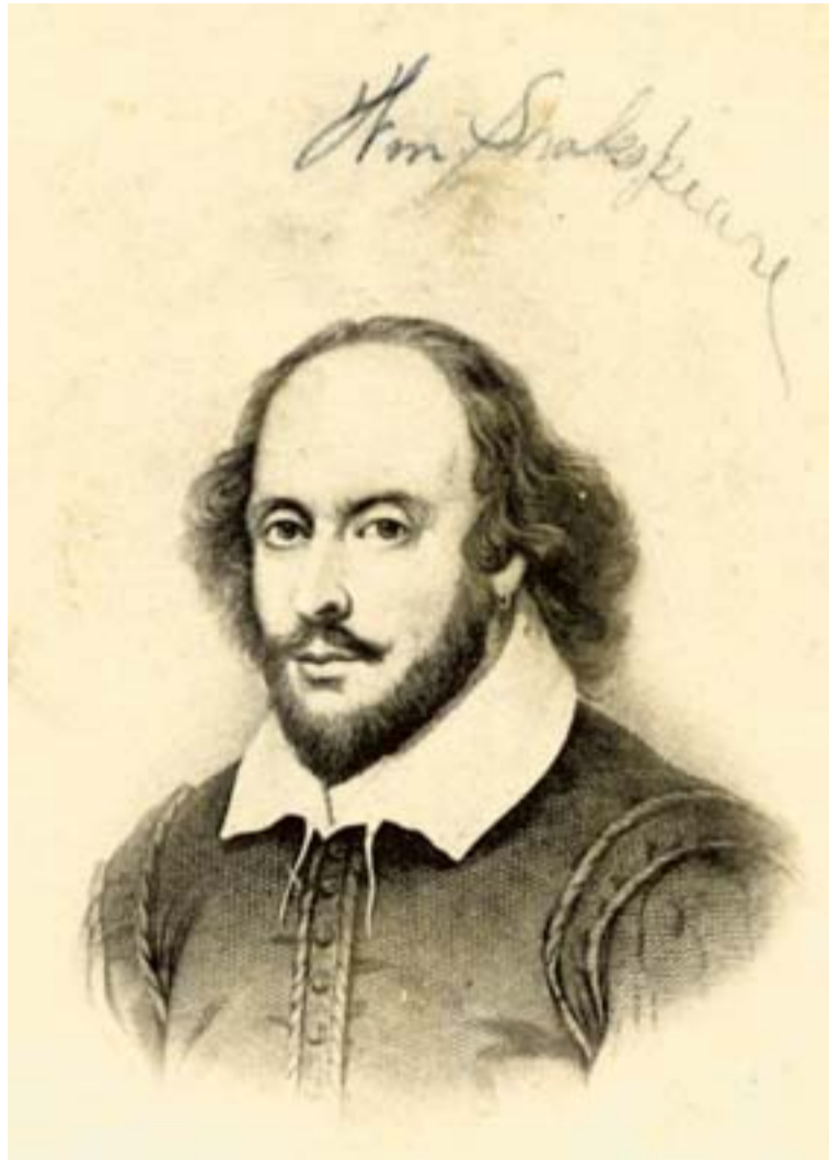
Nejslavnější dramatik William Shakespeare...