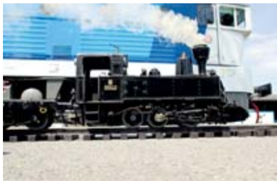
Funkční kopie lokomotivy řady 310.017 v měřítku 1:8 vyrobená Jiřím Sičem.