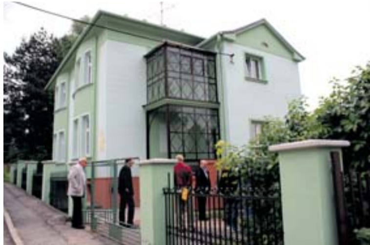
Stonavská vilka, která slouží jako dům s pečovatelskou službou, získala v rámci rekonstrukce i novou fasádu.

„Chtěli jsme, aby i tady mohli seniory trávit čas v komfortnějším