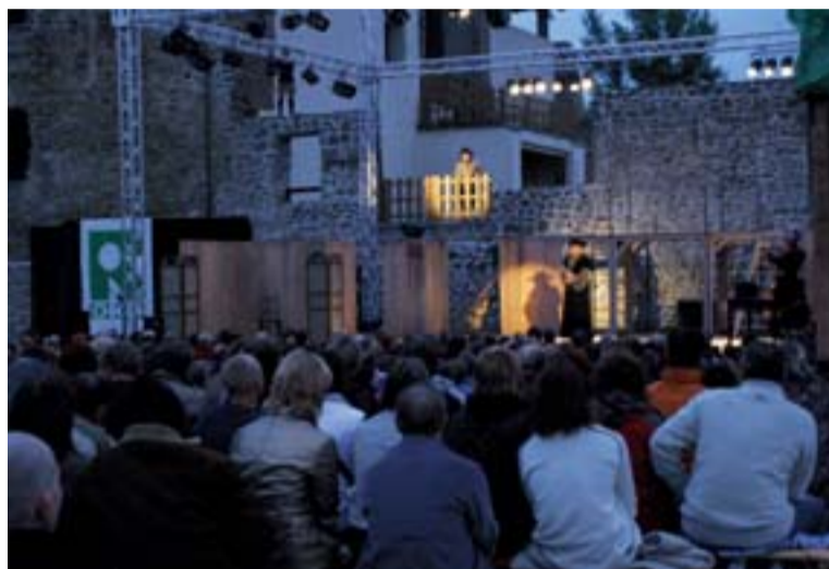
Společnost OKD je partnerem festivalu stejně jako v jeho první, předloňském, ročníku.

E55 Story. Obecenstvo se královsky zahráný do posledního detailu v dokonalých renesančních kostý-