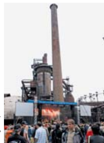
Scena pod fabrycznymi kominami - to Dolny Rejon Witkovic.

„Na szczegóły na razie z wczesnie” - zareagował na pytanie o przy-