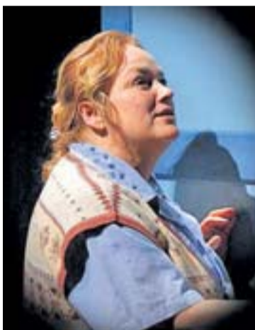
Herečka známá z několika divadelních scén.