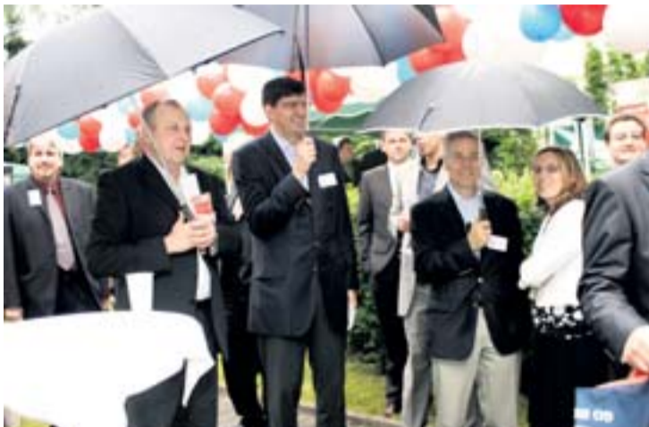
Przedstawiciele OKD i NWR wśród gości XVI Spotkania Biznesu w ogrodach Konsulatu Generalnego RP w Ostrawie.