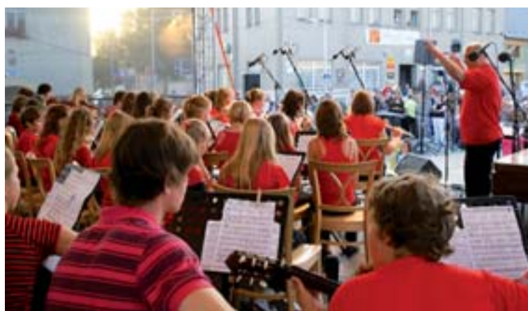
Svátek hudby se stal v Němčicích na Hané přehlídkou volnočasových aktivit dětí a mládeže.

„Cílem festivalu je prezentace uměleckých a volnočasových aktivit dětí a mládeže, vytváření prostoru pro prezentaci naší školy i šikovných dětí odjinud a rozvíjení kulturního života regionu. Ale to všechno má samozřejmě hlubší smysl - rozdávat radost, nese-dět a dělat něco pro děti, pro lidi a taky pro sebe, aby po nás něco zůstalo. To by snad měl být smysl života každého člověka, jinak jsme