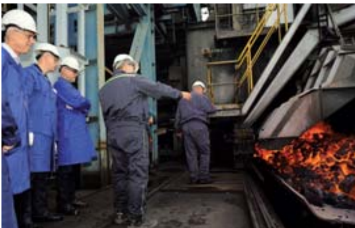
Členové představenstva společnosti New World Resources N.V. v OKK Koksovny.