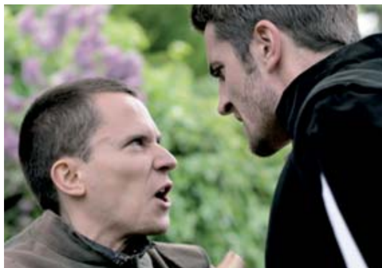
Anglický soubor hraje v alžbětinských kostýmech...

Shakespeareovské slavnosti se pořádají pravidelně o letních prázdninách, během této „sezóny“ je odehráno cca 140 představení. Počty diváků lámou rekordy, loni jich bylo dohromady 87 tisíc. Není to totiž už jen na Pražském, ale i Bratislavském a Brněnském hradě (Špilberku). Ostrava se přidala s hradem na Slezské v roce 2008. uzi