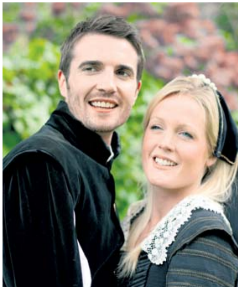
...a Shakespeare v jeho podání je vlastně v originále.