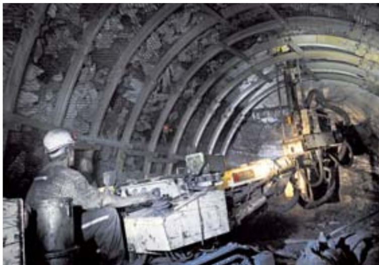
Vrtací stroj z programu POP 2010 při svorníkování na paskovské čelbě.

S oběma uvedenými soupravami vrtali svorníky před postupujícími poruby, instalovali je za postupujícími čelbami, zpevňovali nadložní křížů. Používali celozávitové kotevní tyče (CKT) v délce dvou a tři metrů kotvené lepícími ampulemi „lokset“. Od loňského dubna přešli na lanové kotvy IR-4/B dlouhé pět nebo šest metrů.