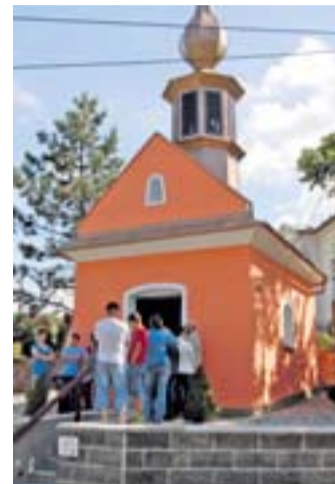
Renovovanou kapličku ve Lhotce...