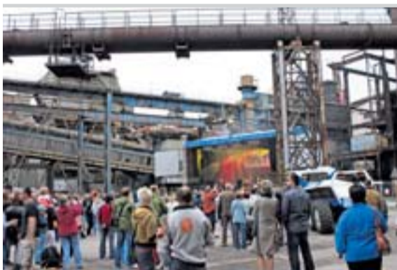
Megakoncert ostravských pěveckých hvězd ve fascinujícím prostředí výjimečné industriální památky - takový byl start programu Léto!!!, kterým chce Ostrava poukázat na své jedinečné industriální dědictví.