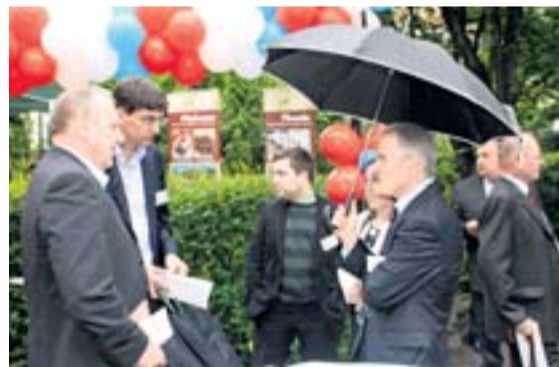
Zástupci společnosti OKD a NWR na 16. setkání podnikatelů v zahradách polského konzulátu.