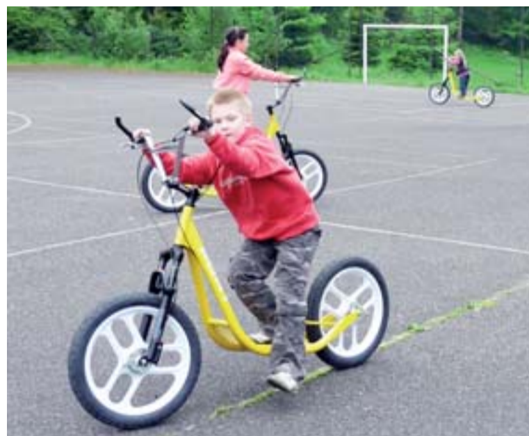
Velký zájem byl o speciální koloběžky.

Odpoledne měli „kovbojové“ westernové představení s lasem, bičem či nožem. Následoval piknik s grilováním. „Pořádáme pro kolegy a jejich děti velké akce, neboť mají značný ohlas. Zaměstnavatel to hraje ze sociálního fondu,“ podotkl odborář. uzi