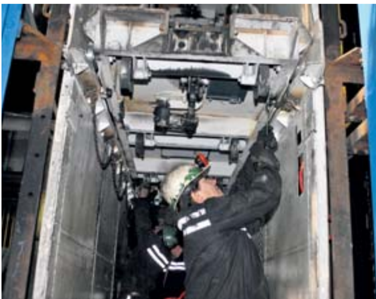
Dopravní nádobu si nechali udělat na míru...