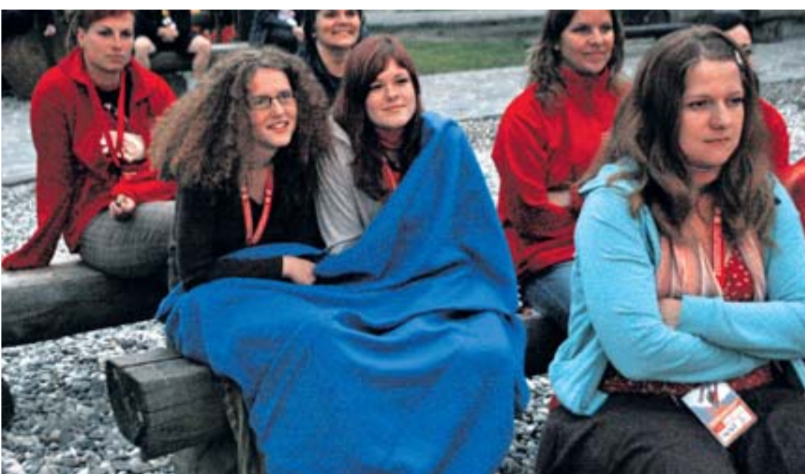
Deky byly na Slezskoostravském hradě na scéně v obou předešlých ročnících.

K večeru totiž bylo na Slezskoostravském hradu, nachá-