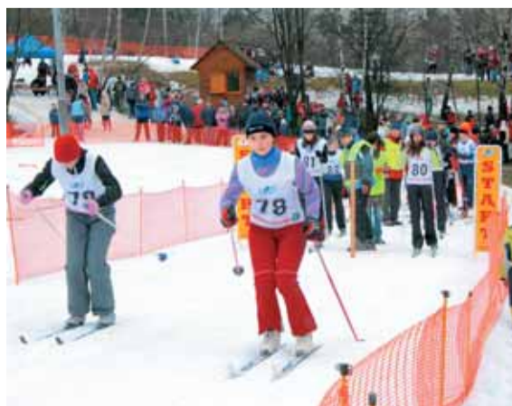
Tuhé boje se odehrávaly na běžecké trati.