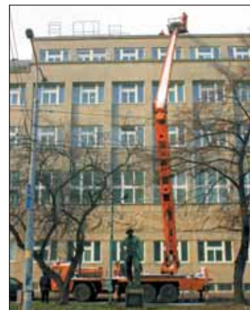
K výměně loga posloužil jeřáb s 27 metrovým ramenem.