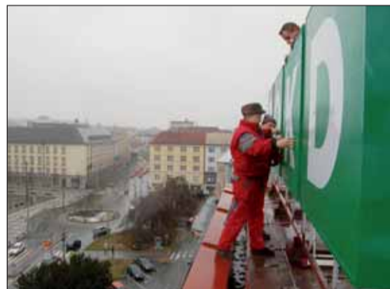
Závěrečná montáž probíhala vysoko nad Prokešovým náměstím.