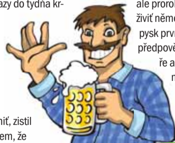
Jak to vidí stryk Lojzek

„To už je stara baja! Když sem to musel v zimě jezdit aji tři razy do tydňa kr-