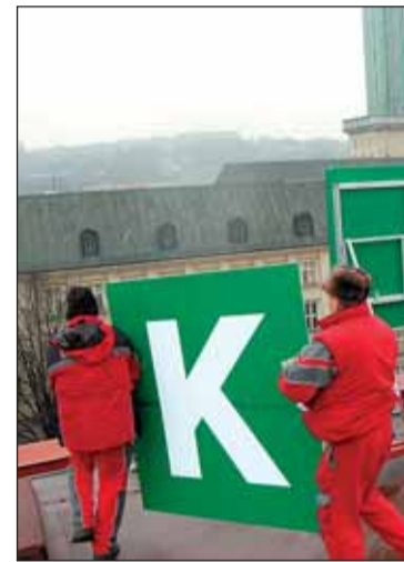
Plexisklové desky tvořící nové logo mají rozměry 150 na 150 centimetrů.