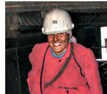
Fárání na ČSM bylo docela jiné než v muzeu. A také špinavější...