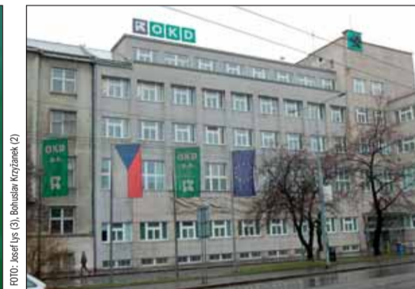
Nové korporátní logo těžební společnosti OKD bude v noci zářít do tmy.