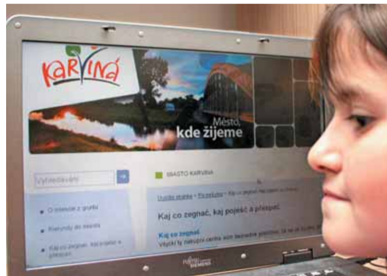
Nové oficiální webové stránky Karviné mají jazykovou verzi po našymu, ve slezském nářečí.

Karviná má možná jako jediné město u nás oficiální internetovou stránku i v nářečí