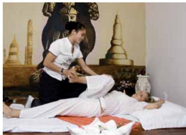
Poukázkami lze platit i masáže.