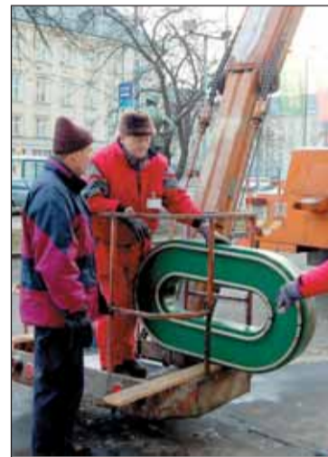
Písmena ze střechy budovy OKD se po letech ocitla opět na pevné zemi.