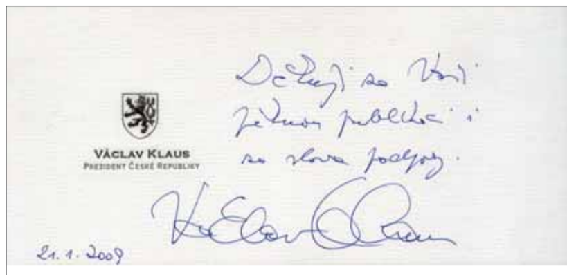
Poděkování prezidenta České republiky Václava Klause Klubu přátel Hornického muzea v Ostravě.