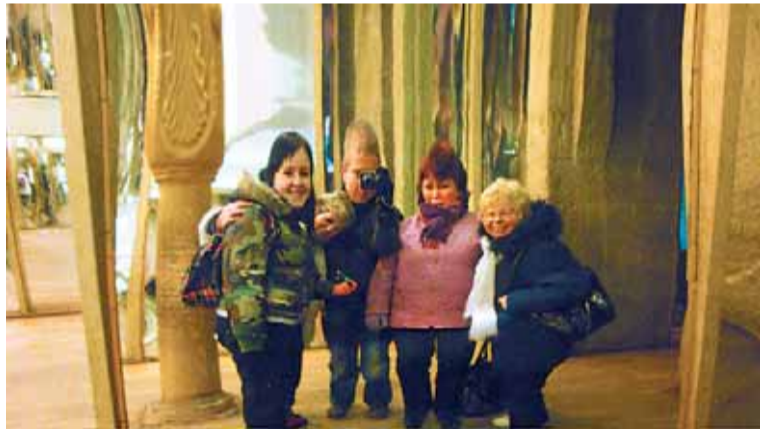
V zrcadlovém bludišti na Petříně se děti při pohledu na své zpitvořené postavy dobře bavily.

pingerová, která účastníky v pátek a v sobotu 30. a 31. ledna doprovázela.