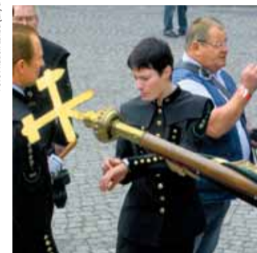
Hornický den 2008, v mundúru ve slavnostním průvodu.