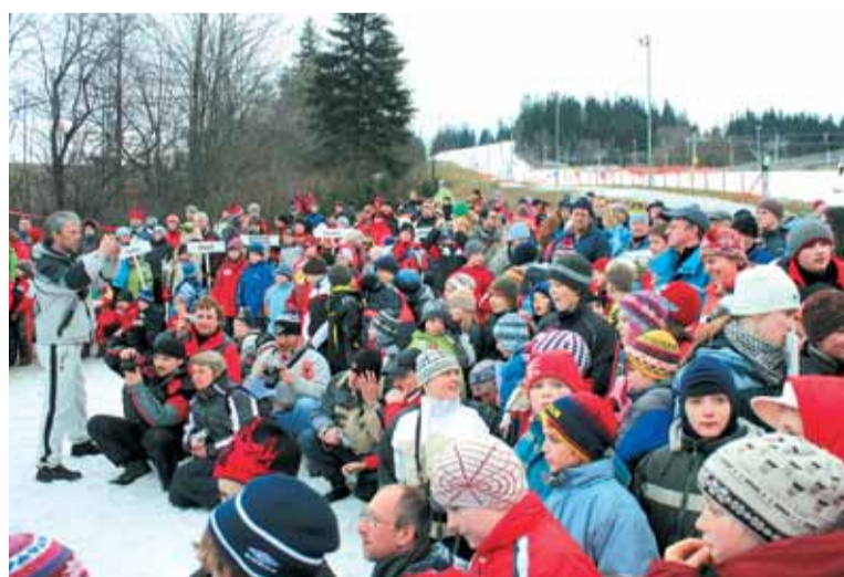
38. ročníku akce Zjazd Gwiazdzy se zúčastnilo okolo 440 žáků z 24 polských škol.

Tradice lyžařských závodů Zjazd Gwiazdzy vznikly v me-