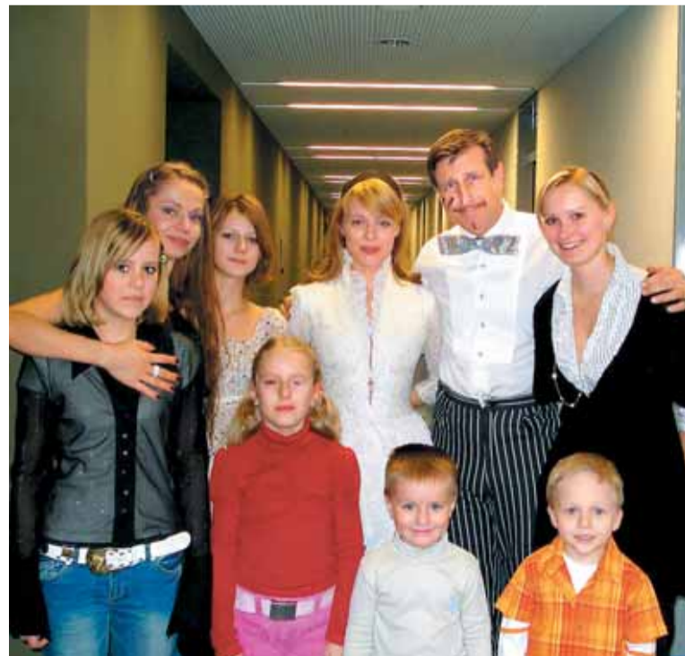
Po divadelním představení Limonádový Joe měli někteří z výletníků to štěstí vyfotit se v záku- lís s hercem Václavem Vydrou, který ztvárnil Horáce Hogo Fogo.

Ještě jsem matičku Prahu na vlastní oči nespatriil, proto jsem cestou v autobuse ve sladkém spánku o ní snil. Kuřecí řízek na oběd dodal mi nových sil, metro, lanovka a pohled z Petřína nás všechny okouzliil. V zrcadlovém labyrintu smích všude jen zněl, křivé nohy, velká hlava, to vám byla fakt zábava. Hradčany, Malá Strana, Karlův most sáhnout si na ocas pro radost. Orloj, Cesta králů, Václavák, u koně však řekly naše nohy stát. Metro, sprcha, kuře s rýží toť naše záchrana, též posezení s kamarády, spousta vtipů a vzpomínání na Krétu a Barboradování. Dopoledne super kino, ještě teď' dinosaury vidím, odpoledne v muzikálu na živém bílém koni Limonádový Joe zlé padouchy honí. A jak zní to pořekadlo? Nakonec vše dobře dopadlo. Všichni jsme se ve zdraví vrátili a my děti z Barborky se super bavily.