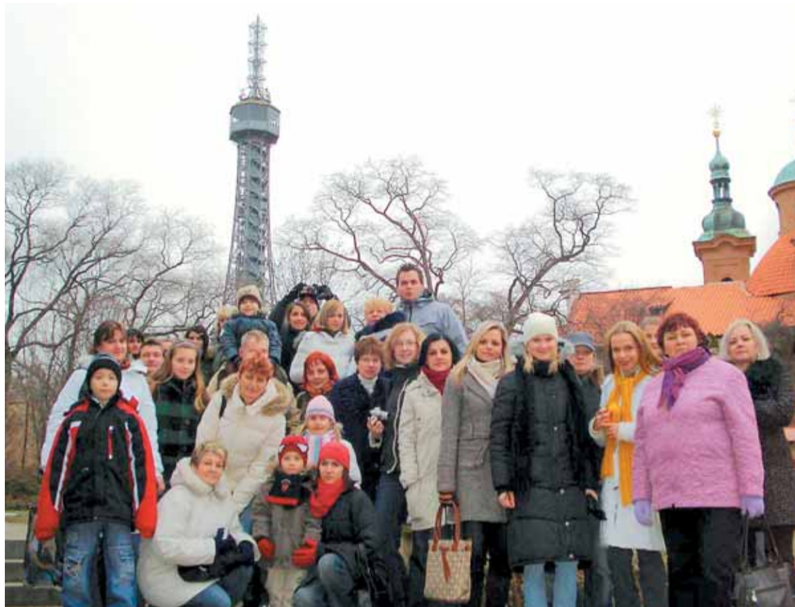
Na výpravu do Prahy použila Barborka peníze „vyšlapané“ na rotopedech v rámci Hornických slavností OKD. Peníze za našlapané kilometry poskytla Nadace OKD.