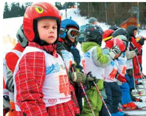
Na start slalomu se postavily i děti z 1. tříd a mateřských školek.