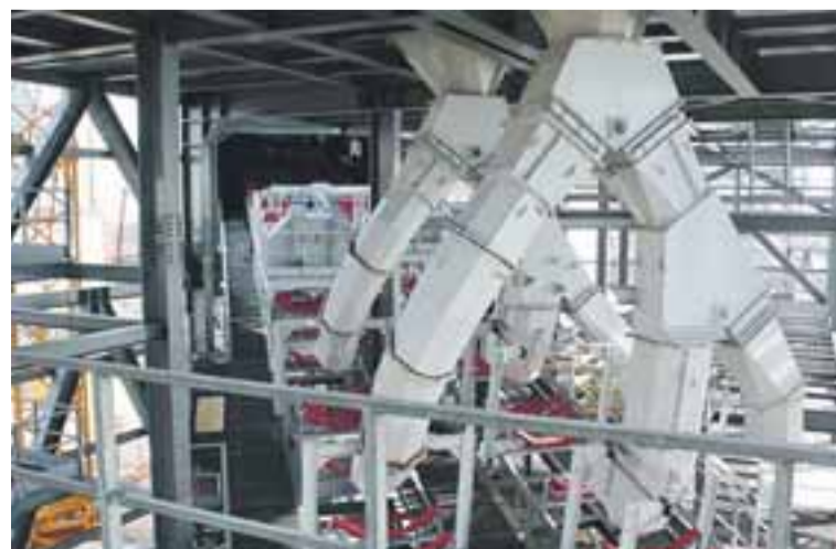
Přesypy mezi jednotlivými technologickými linkami pásové dopravníky TOWER T2.