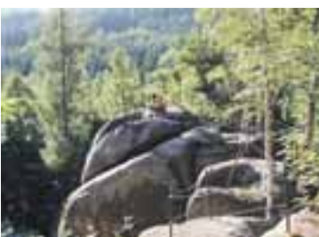
Venušiny misky, Smolný vrch u Černé Vody