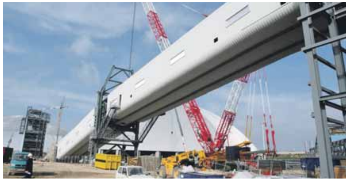
Montáž dopravníkových mostů, v pozadí kopule krytých skládek uhlí.

Při provozním spuštění je obvykle více problémů s elektrovybavením