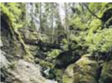
Bílá Opava, Karlova Studánka