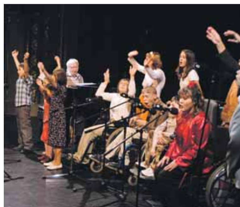
(vs) Z ostravského koncertu Všechny barvy duhy II.

Více informací o organizaci, která dává handicapovaným lidem nový smysl života, najdete na webu www.uspostrava.cz .