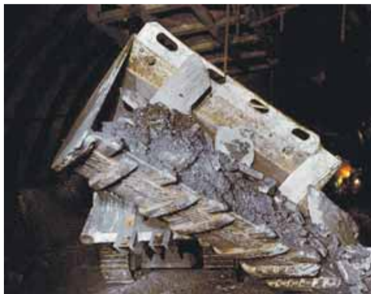
Paskovským havířům udělají lopatu k nakladači doslova na míru.