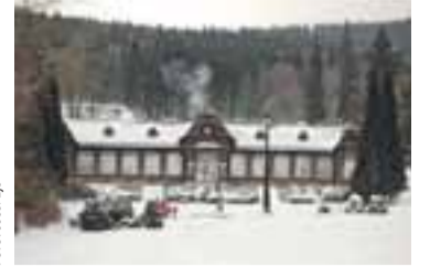
V objektu Letních lázní hosté mj. najdou solnou jeskyni a bazénový komplex s termální vodou.

1998 jsem byl z dolu vyrazen pro nemoc z povolání. Zdejší vzduch a celkový pobyt mi náramně svědčí. Po procedurách jdu nejčastěji na běžky, pořádně potrápím tělo, plíce. Jezdím sem každé dva roky, pokaždé v zimě. S chlapy se už známe, rádi vzpomínáme na své zážitky z šachet, pohodička.“