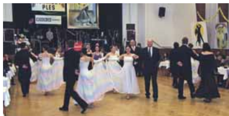
Předtančení souboru Bledowianie a některých manažerů ze šachty.