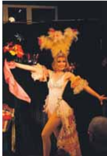
Publika se líbí kouzlení ve stylu brazilského karnevalu.

KARVINÁ – Ve čtvrtek 26. a v pátek 27. února bude poslední příležitost navštívit velkou výstavu modelářů a jejich výtvorů (na snímku) v Galerii Zdravého města ve foyer Slezské Univerzity. Na akci Model Hobby se prezentují také nadšenci z KSVČ Juventus, kteří pracují na šachtách OKD. (uzi)