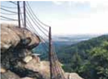
Čertovy kameny, 2 km od Jeseníku