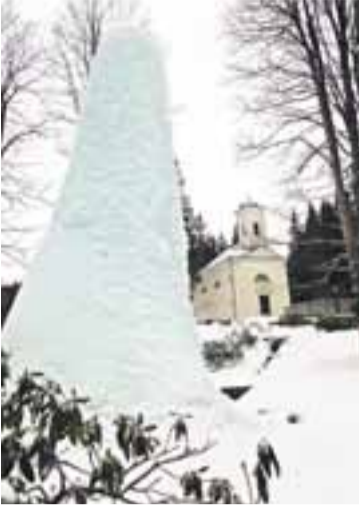
Jeden z pramenů v Karlově Studánce v zimě vytváří mnohametrovou ledovou homoli.