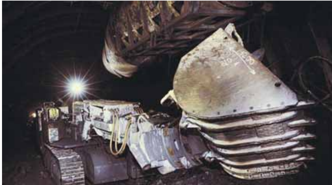
Nakladač K 312 LS pořízený v rámci programu POP 2010 pomůže naplnit roční plánovanou metráž.

„Pro přiblížení, představu a možnost srovnání uvádíme ně-