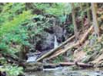
Nýznerovské vodopády, 5 km od Žulové