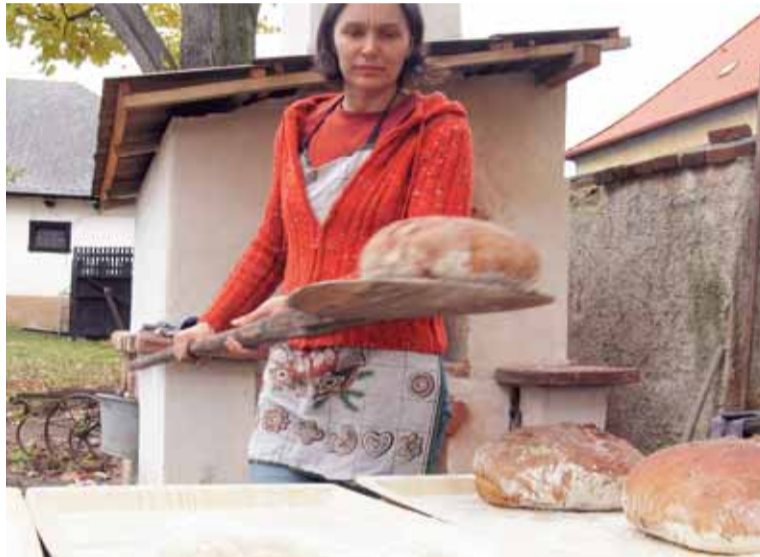
Hotova je další várka pravého domácího chleba upečeného v Ledovci.

Neziskovka pracující u Plzně s mentálně postiženými a duševně nemocnými má zajímavou terapeutickou aktivitu