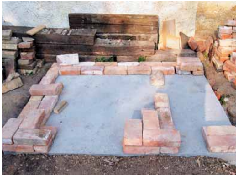
Stavělo se venku na zahradě, cihlu po cihle.

PLZEŇ – Příspěvek patřící finančním objemem k těm menším dostali od Nadace OKD v Ledovci na Plzeňsku, kde pomáhají mentálně postiženým a duševně chorým. Přesto svůj účel splnil a užitek bude oněch pětadvacet tisíc korun přinášet, dokud bude pec na chleba za tyto peníze vybudovaná stát a fungovat.