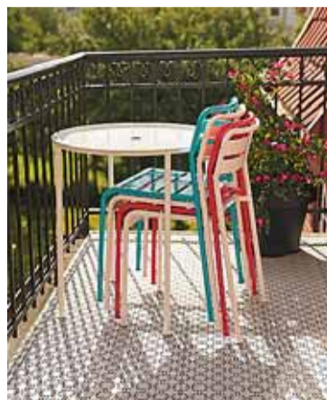
Balkony musí na jaře ožít!

LÄCKÖ, které však nechybí dnešní zjednodušující moderní prvky, jako je stohovatelnost křesel a židlí nebo počasí odolný materiál, ten byl použit i při výrobě další letní série BLANKÖ. Jde o chyt