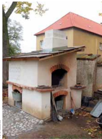
Takhle v Ledovci využili příspěvek NOKD.