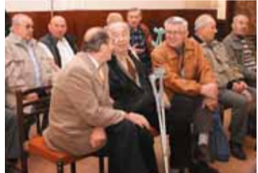
Zdobí je šediny, mnozí si pomáhají francouzskými holemi, ale na schůzku s kamarády ze šachty je to stále táhne.