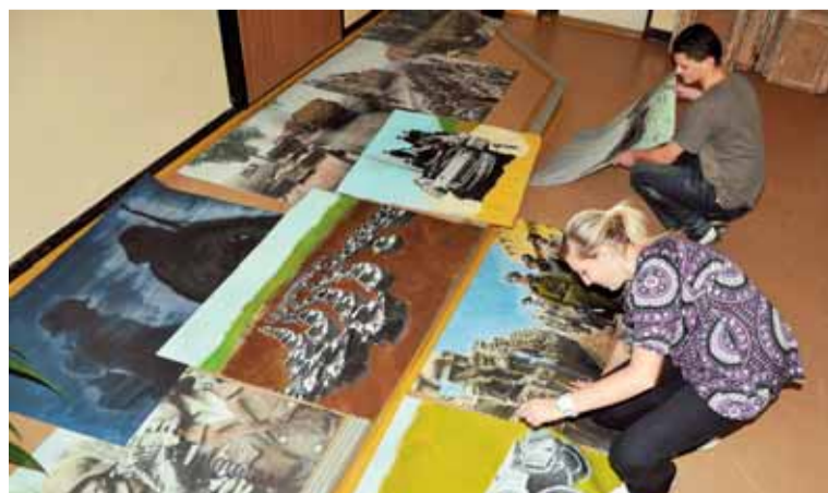
Mezi studentskými příběhy převládaly osudy jejich rodin za II. světové války.