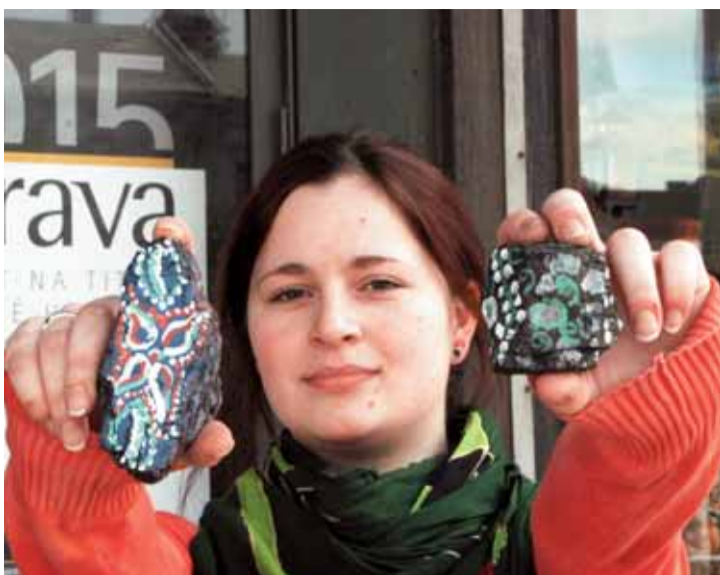
Naprostojedinečné, veskrze ostravské – velikonoční kraslice z uhlí.