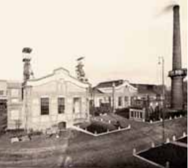
Závod Ludvík v roce 1926

V novém prádle byl do provozu uveden těžkokapalinový rozdrůžovač Chleben-Švejda (výrobce Škoda Plzeň), který nahradil původní sazečky. Tak jako na jiných úpravnách uhlí v OKD byla při projektování rekonstrukce úpravny uhlí Dolu J. Fučík podceněna zrnitostní skladba těžženého uhlí. Při vyšší mechanizaci těžby v dole se zvýšil i podíl zrna pod 10 mm, takže při úpravě se zvýšil podíl uhelných kalů, začaly vznikat problémy s odvodňováním, usazováním a těžním uhelných kalů.