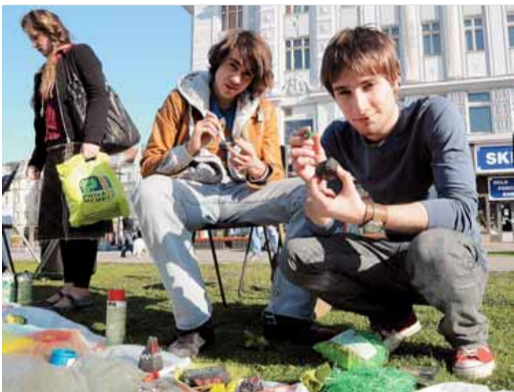
Do malování se na Masarykově náměstí pustili i mladí divadelníci.

V neděli 4. dubna pak havířův vnuk sebral kýbl s uhelnými kraslicemi a za účasti fotografa zamířil na některá místa v centru města včetně těch, co souvisí s těžbou uhlí. Zde vybírali speciální kolekce a fotografovali je s odpovídajícími kulisami. Snímky chtějí prezentovat přímo ve Staré Aréně, která