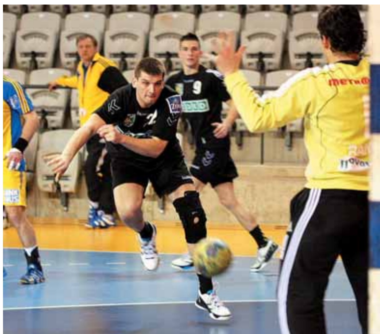
Házenkáře Baníku OKD Karviná čeká dnes od 18 hodin další duel semifinálové série extraligy házenkářů.

Házenkáři karvinského HCB OKD potřebují proti Dukle znovu diváckou pomoc