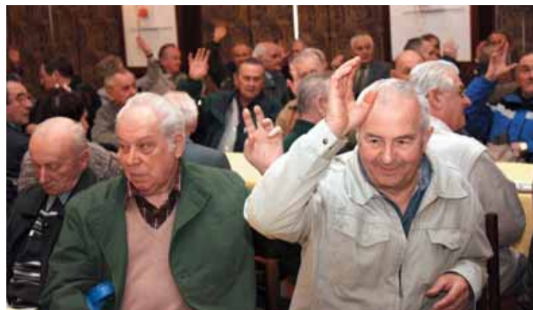
Ačkoliv Důl Heřmanice už mlčí 17 let, heřmaničtí důchodci jsou stále schopni zaplnit sál.

Činnost organizace odpovídá věku členů. Na schůze výboru navazují pravidelná setkání s jubily, která se konají vždy dvakrát do roka. Těch se v posledních dvou