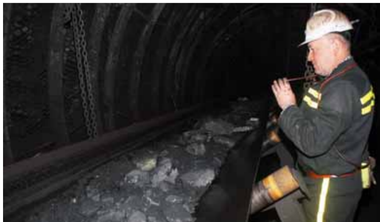
Tak vypadá zvýšení kapacity centrálního odtěžení z 063. sloje na Dole Paskov.

„Všichni pochopili důležitost úkolu a souhlasili s přesunem pracovní doby. Nic nesmělo být – a také nebylo – na překážku plynulosti provozu, údržby a bezpečnosti,“ doplnil Pieczka s tím, že hojně využili všech volných chvil. Razili výklenky pro pohony, rozšiřovali profil pro průjezd závěsné dopravy, přibírali počtu pro ustavení rozměrnějších pohonů a napívacích zařízení i předmontáž zavěšení pro dopravníkové tratě. Radek Lukša