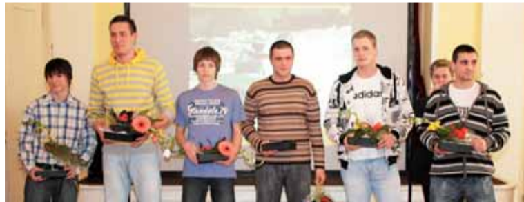
Házenkáři HCB OKD na parketu nejlepších sportovců města Karviné za rok 2009.

„Asi to svědčí o poctivé práci kluků i trenérů v našem klubu. Spousta hráčů již nakoukla do reprezentačních