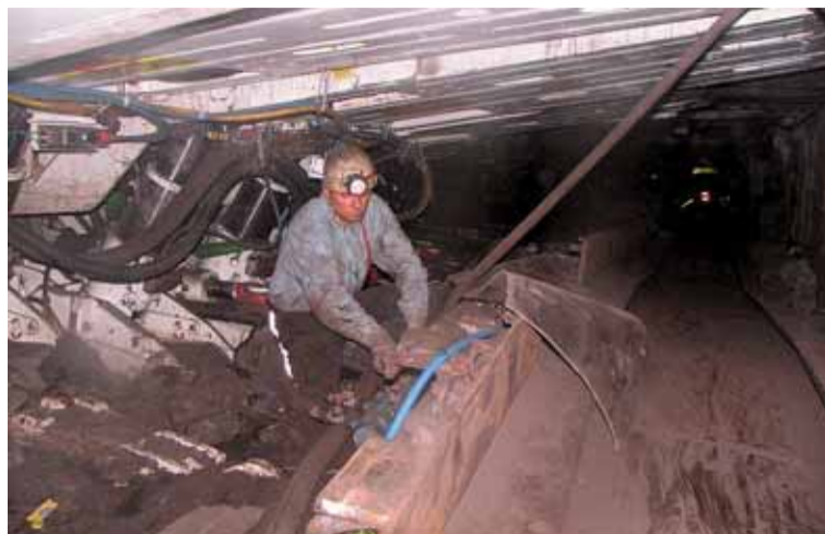
V porubu vybaveném technologií Bucyrus DBT 600/1400 pro dobývání nízkých slojí.

Zkušenosti získané v těchto tvrdých podmínkách lazeckí horníci a technici zúročili při úpravách těžního zařízení pro jeho další nasazení. Jak informoval Pamánek, šlo například o výměnu překládacího zařízení před porubem za chodbovou sekci. Zvětší se tak manévrovací možnosti překladače, který může přibírat počvu před porubem