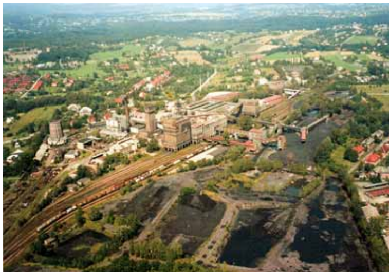
Letecký pohled na závod Pokrok s úpravnou, skládkou paliva a závodní vlečkou.