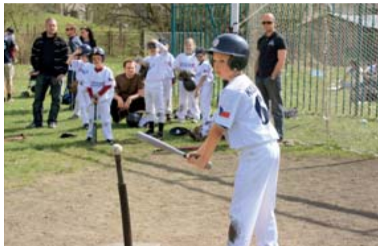
Děti hrají zjednodušenou verzi baseballu, kdy odpalují míčky z pevných stojanů.