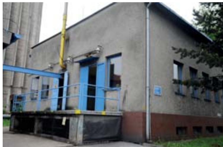
Pohled na budovu degazační stanice.

Pokračování článku v příštím čísle Horníka Libor Kusina, projektant degazace OKD