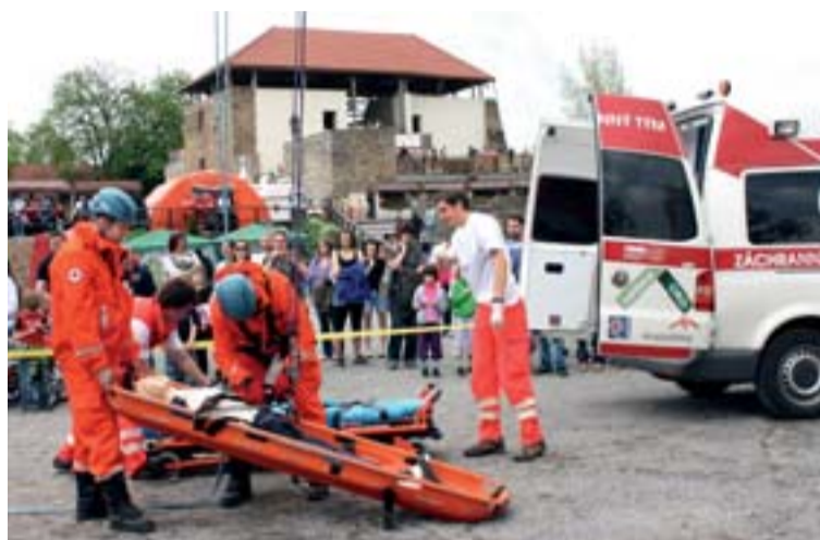
Ukázka spolupráce báňských záchranářů s členy záchranného týmu ČČK.

A co teprve, když důlní záchranáři při ukázce evakuace postiženého z 20metrové výšky pomocí lezecké techniky předvedli, že umí nejenom v dole, ale i pod oblaky! Při pohledu