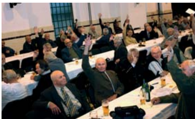
Členové Klubu přátel Hornického muzea v Ostravě zvolili na své výroční členské schůzi nové vedení do roku 2012.