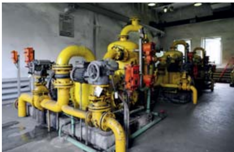
Vodokružné vývěvy typu RLP 62/73.

Degazační systém je nutno vybudovat dle předem schváleného projektu. Na svém počátku je tvořen degazačními zdroji, což jsou utěsněné a uzavřené degazační vrty, navrtané do průvodních nadložních, případně podložních hornin předmětného porubu či raženého dlouhého důlního díla. Degazačním