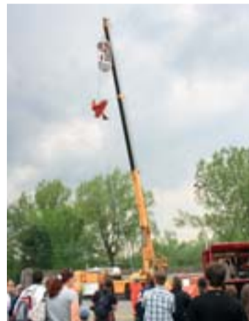
Báňští záchranáři umí i pod oblaky.