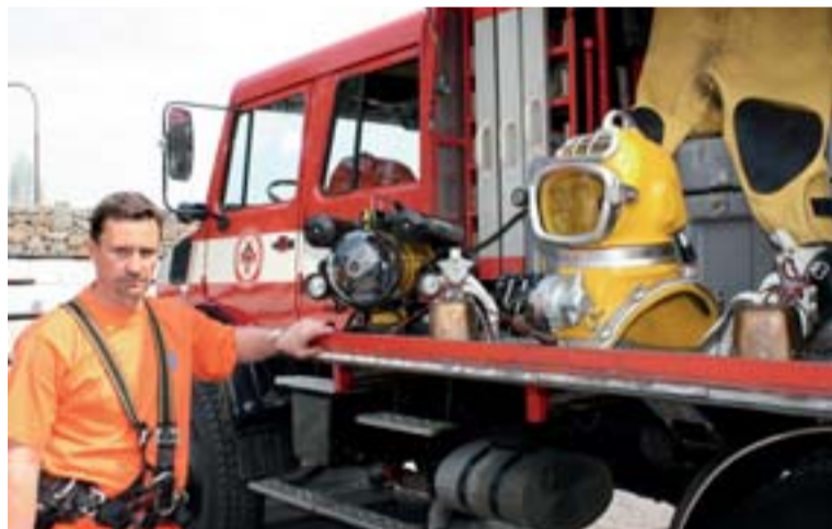
Četař potápěčů HBZS Radim Kocián předvádí těžký skafandr pro práci ve velkých hloubkách a podvodní kameru pro vyhledávání osob a předmětů a záznam akcí záchranářů pod vodou.