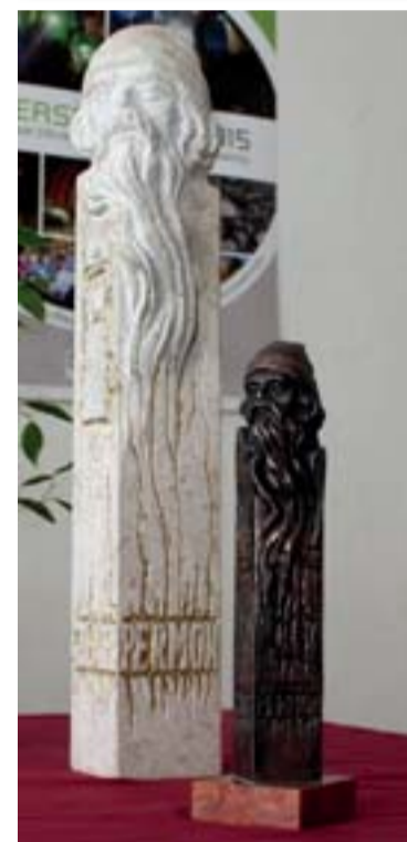
Cena za bezpečnost v hornictví Zlatý Permon se skládá ze dvou uměleckých soch: velká mramorová je putovní a každý vítěz ji musí po roce opět vrátit. Druhá menší je bronzová a zůstává vítězi navěky.