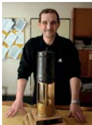
...a u zaslouženého fedrunkového kahanu.