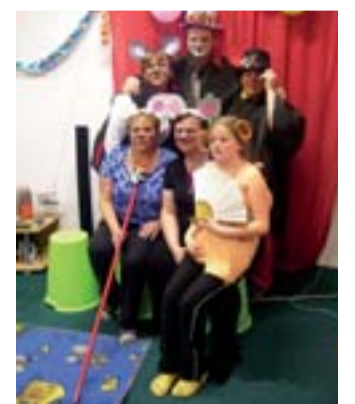
Karneval ve znamení myši a myšáků.

BUDIŠOVICE – Maminky a děti z Občanského sdružení svatá Barbora prožily uplynulý víkend v myším království, přesněji v areálu Myšinec u Budišovic. Tři dny uprostřed přírody plné her a zábavy vyvrcholily sobotním výletem do kravařského aquaparku a ke křesťanskému labyrintu v Bělé, jehož vybudování už dříve podpořila Nadace OKD.