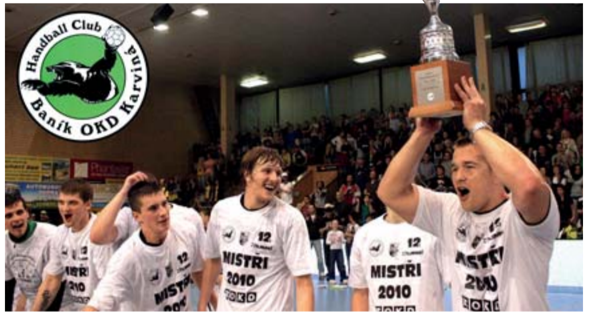
Házenkáři Baníku OKD Karviná vybojovali posedmě v řadě mistrovský titul a s pohárem nad hlavou slavili svůj úspěch.

Díky podpoře OKD má karvinská házená mistry extraligy i nejlepší systém péče o mládež