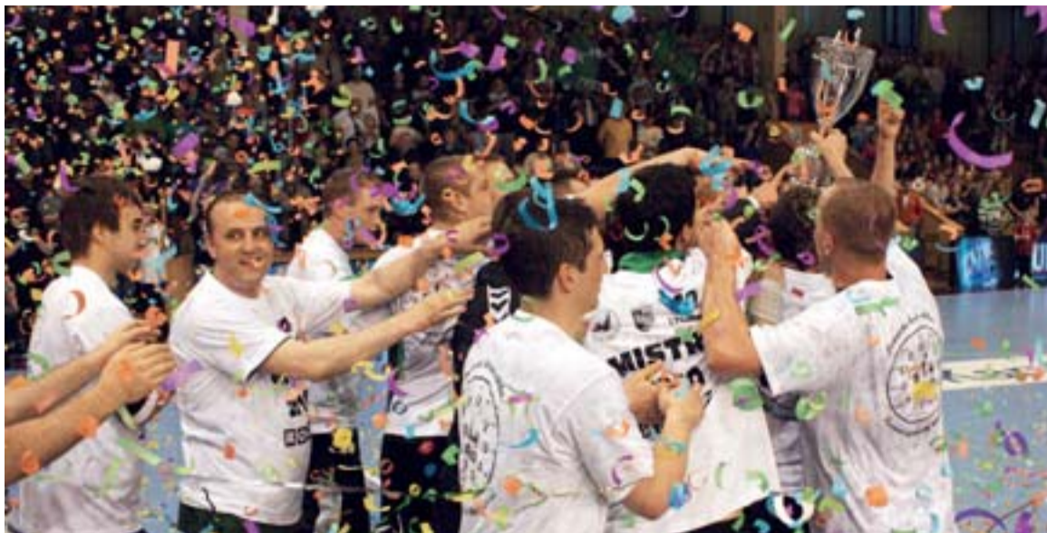
Házenkáři HCB OKD se radují s pohárem pro mistry extraligy.

Karvinští házenkáři opět triumfovali v extralize, následné oslavy nebraly konce