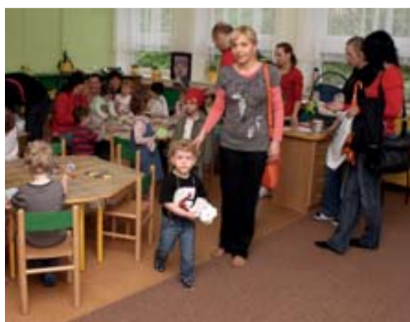
Klokánek byl na oslavách svátku všech maminek úplně plný.

Ten je určen pro „předškolkové“ děti ve věku od dvou do šesti let, přičemž jeho zaměření je hlavně na autisty, chlapce a dívky s opožděným vývojem, zvláštními v sociálním kontaktu či chování. „Začlenění handicapovaných mezi,