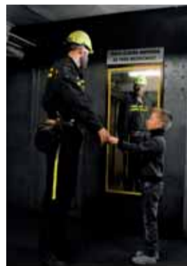
Ruce na to - vrať se táto!

Jeden motiv obsahuje i bílou siluetu ve skupině havířů po vyfárání. „Tím chceme upozorňovat na to, že spousta lidí ze šachty zná člověka, komu se v dole něco stalo, anebo přišel při práci o život. Všichni se musí snažit, aby v partě to prázdné místo nebylo,“ doplnil Zajíček.