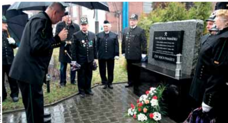
Uctění památky obětí důlního neštěstí v Dole ČSA.