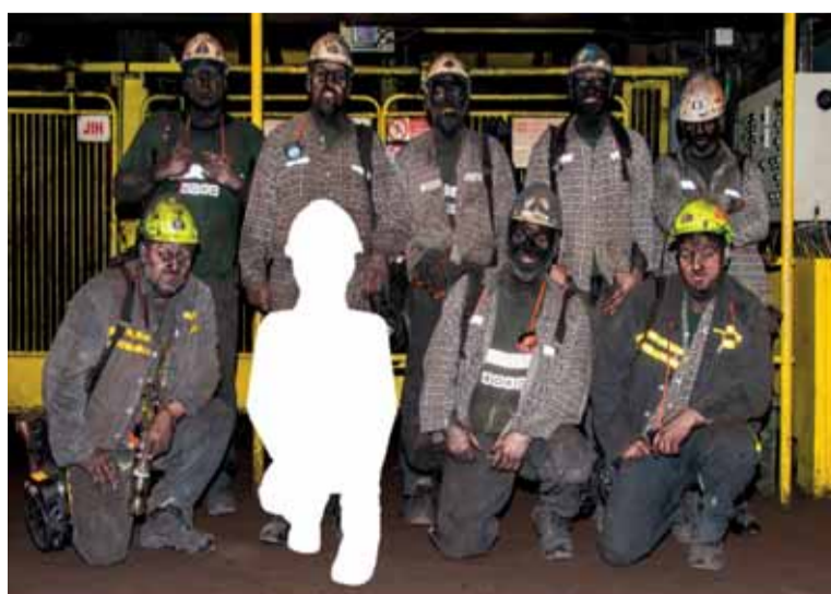
Musíme být vždy kompletní