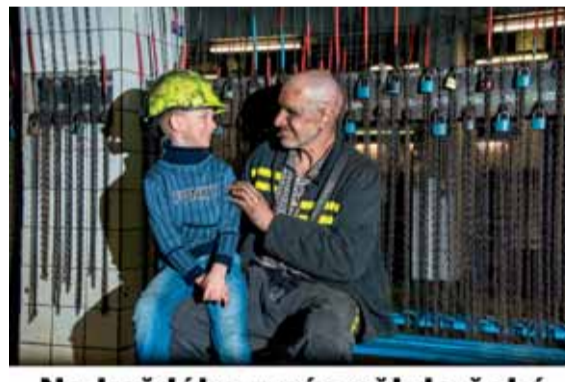
Na každého z nás někdo čeká.