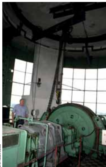
Těžní stroj v kruhové těžní věži v lokalitě Sviadnov.

Těžní stroj je však unikátem chráněným památkáři stejně jako těžní věž; v OKD už takové nejsou. Sviadnovská vtažná jáma má těžní zařízení dvojnásobně se čtyřetážovými dopravními nádobami a je vyložena na úrovni III. patra (710 metrů pod hladinou). Níže je šachta zatopená.