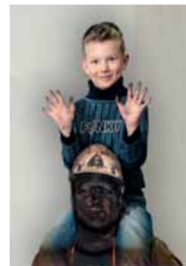
Pracuj bezpečně, doma tě čekají.