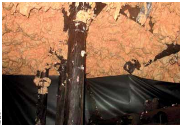
Dotěsnění vrchní úvrati porubu 332 209.

„Věděli jsme předem, že to nebude nic jednoduchého. Už před dokopáním porubu svolával závodní Karel Blahut koordináční schůzky provozů důlně bezpečnostních služeb, vybavování a likvidace a důlní dopravy, na nichž se probíraly postupy pro nadcházející situace a hlavně výkliz,“ popisoval vedoucí provozu důlně bezpečnostních služeb (DBS) Martin Szturc. Ve stěně 332 209 totiž vzhledem k charakteru průvodních hornin a erozivnímu uložení slaje docházelo ke spouštění zbytků uhlí do závalových prostor. „Zasedaly kvůli tomu i preventivní havarijní komise za účasti zástupců DZ 2, OKD a HBZS. Očekávali jsme zápar, zvýšené vývinu oxidu uhelnatého a vzhledem k silné inertizaci porubu dusíkem navíc i pokles kys-