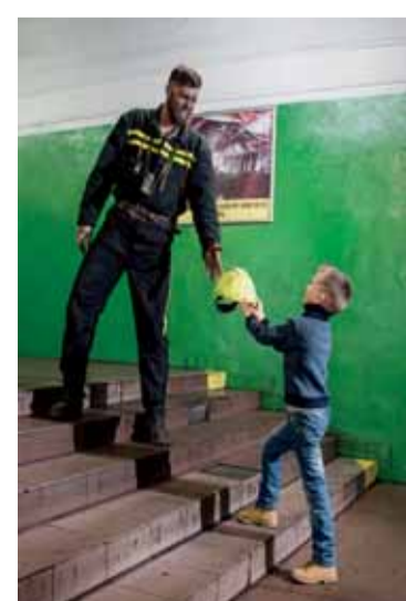
Pracuj bezpečně, doma tě čekají.