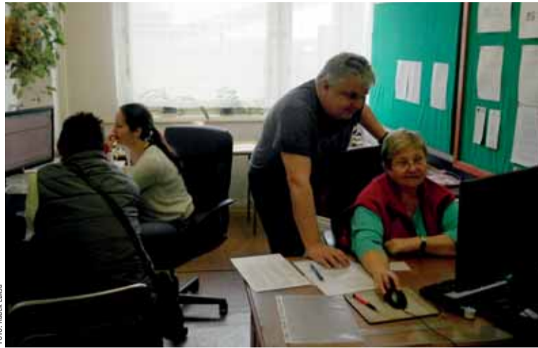
Dva noví klienti v kanceláři Nové šichty v lokalitě Staříč.

„Momentálně kontaktujeme všechny klienty NŠ a zjišťujeme zpětnou vazbu – to znamená, zda mají stále o naše služby zájem, nebo zda chtějí svou evidenci ukončit. S ostatními zá-