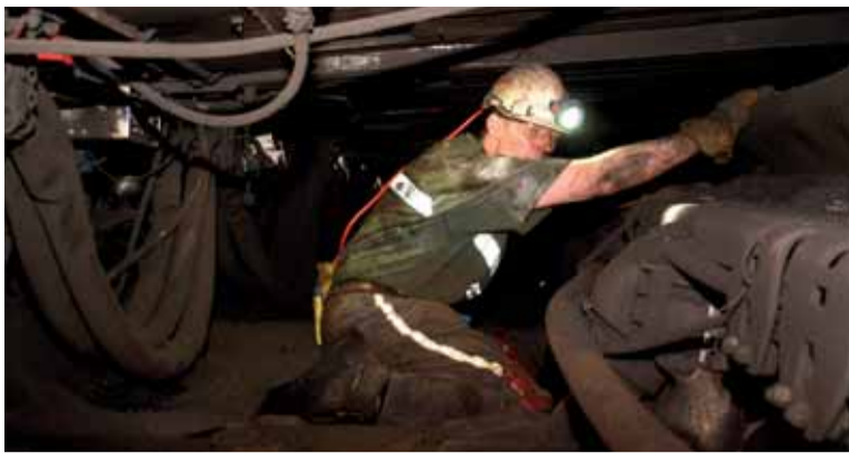
Pracoviště kolektivu ve sloji Max v lokalitě Lazy.