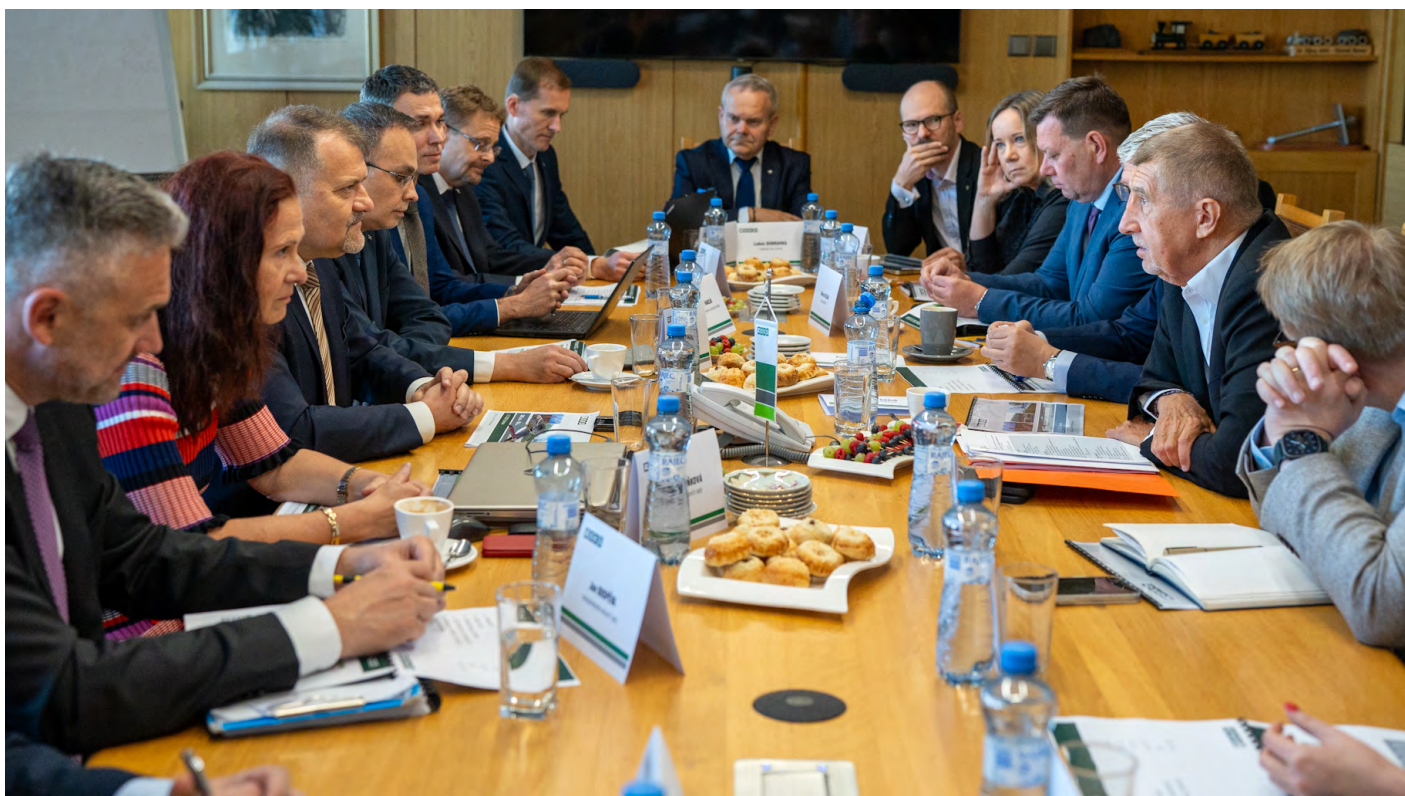
Setkání členů vedení a dozorčí rady OKD s vládní delegací ve Stonavě.