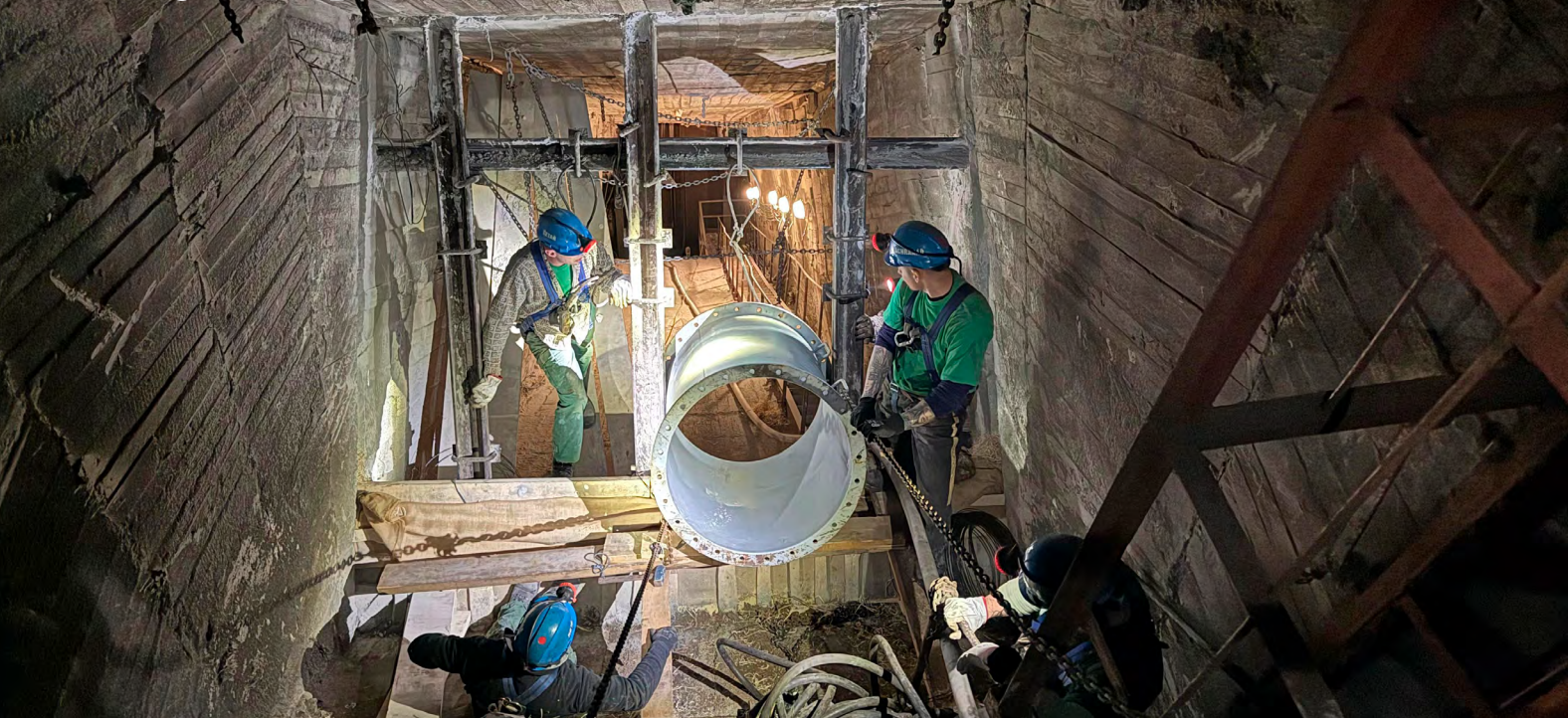
Výstavba protivýbuchové hráze.

Práce, které v konečném důsledku povedou k bezpečné likvidaci Dolu ČSM a zachování možnosti těžby metanu, začaly již ve druhé polovině roku 2025. Tehdy jsme zahájili stavbu první z 87 hrází potřebných pro uzavření všech důlních děl. V současnosti je hotovo 72 hrází a zbývá jich postavit 15. Poslední dvě budou dokončeny letos v červenci. Provedení a postup stavby jednotlivých hrázových objektů byl stanoven v projektu technického plánu likvidace dolu tak, aby bylo po celou dobu zachováno bezpečné větrání dolu.