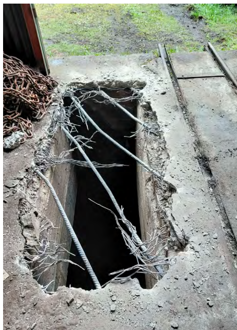
Průraz do podpovrchového kanálu ČSM-Jih.

vých kanálů cementopopílkovou směsí. Kanály se nacházejí těsně pod povrchem v okolí ústí úvodních jam a slouží při provozu dolu pro vedení kabelů, potrubí, únikové východy, ohřev vtažných větrů a podobně. Na jižní lokalitě už v kanálech stavíme opěrné zdi pro jejich vyplnění a provádíme průrazy z povrchu. Všechny práce v úvodních jámách směřujeme tak, abychom dodrželi termín zahájení jejich vyplňování v prosinci 2026 na Jihu a na přelomu ledna a února 2027 na Severu. Nejdéle při této přípravě bude trvat betonáž jámových zátek, kde musíme mezi jednotlivými