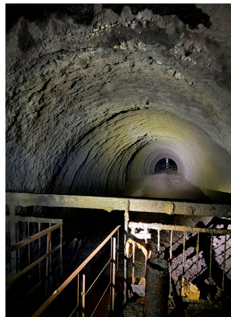
Část větrního kanálu od výdušné jámy k hlavním ventilátorům ČSM-Jih.