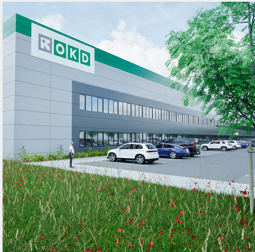
Návrh průmyslové haly v Karvině-Starém Městě.

Své pozemky hodlá OKD využít k průmyslové i bytové výstavbě. „V průmyslové zóně v Karvině-Starém Městě chceme na pozemcích o rozloze 7 ha vybudovat průmyslový areál, jehož součástí bude hala o velikosti přes 30 000 m 2 . Nabídneme zde k dlouhodobému pronájmu prostory vhodné pro lehkou výrobu a skladování podle individuálních požadavků klientů,“ vysvětlil Aleš Kytnar, manažer pro nemovitosti. Areál nabízí výbornou dopravní dostupnost na dálniční síť a dále do České republiky, Polska a na Slovensko. Předpokladem pro realizaci průmyslové haly je dohoda s klienty. „Na pozemcích o velikosti 29 ha v Karvině-Mizerově chceme vybudovat bytové domy a objekty občanské vybavenosti, které budou taktéž určeny k dlouhodobému pronájmu,“ doplnil Aleš Kytnar.