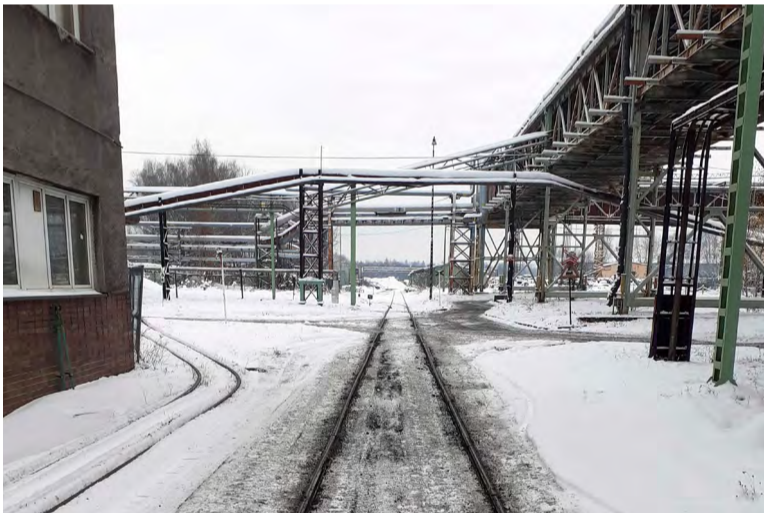
Prosincová nadílka na stonavské šachtě.

Zdůraznil rovněž, že lidé z Farmy Stonava, která byla určena jako hlavní „odklížeč síla“ pro tuto zimu, se každopádně snažili. A pokud to šlo, byli tam, kde měli být.