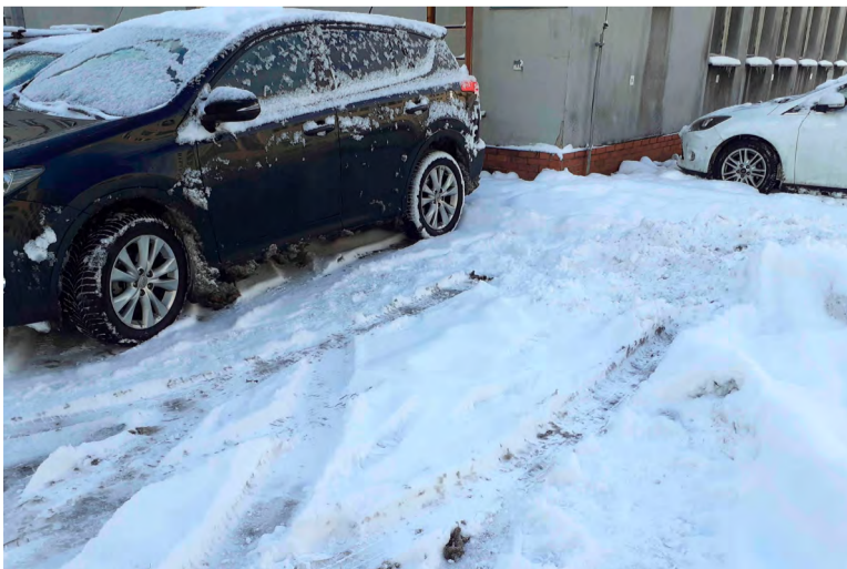
Zaměstnanci si museli auta před cestou domů odhrabat.

„Očekávám, že příroda v příštích měsících ještě ukáže svou chladnou tvář,“ zakončil Ocisk.