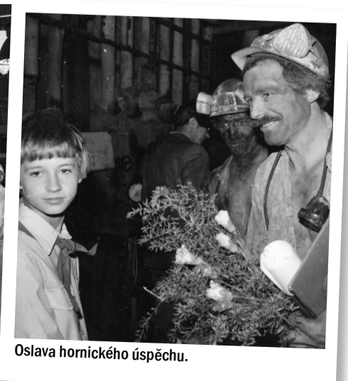
Oslava hornického úspěchu.