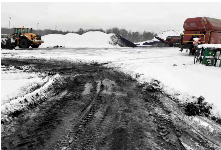
Sněžník ztěžoval pohyb pěších i vozidel.