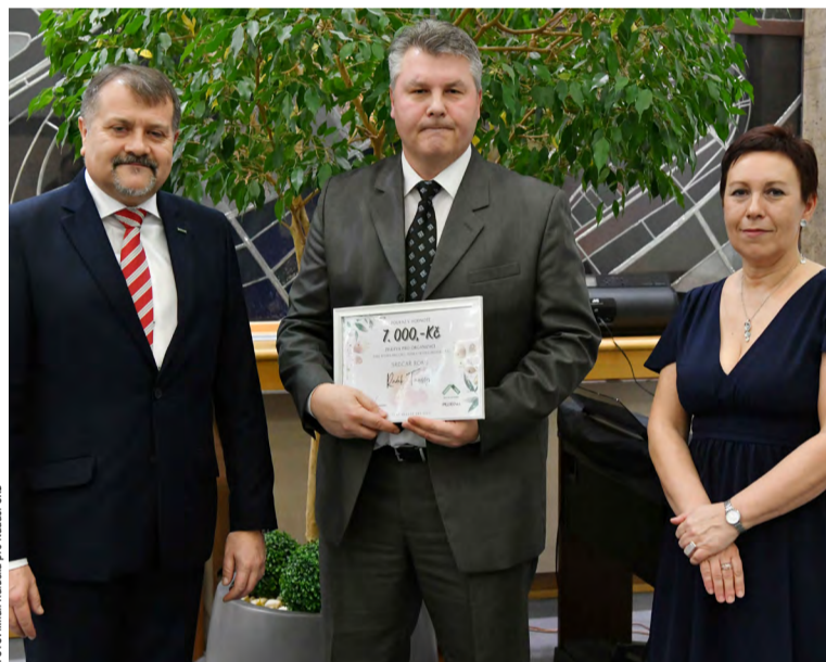
Srdcař roku (uprostřed) s předsedou představenstva OKD a ředitelkou NOKD.