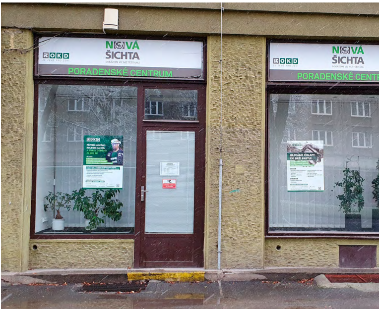
Poradenské centrum OKD v Karviné.