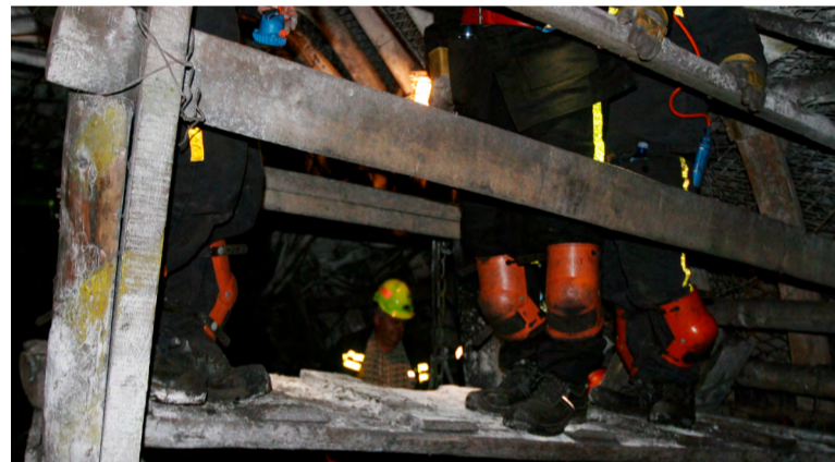
Chůze byla v revíru stále nejčastější příčinou úrazů.

si s povrchových se bude vycházet z toho, kdo pracoval ve kterém čtvrtletí bez registrovaného úrazu – tyto bude čekat odměna. Na peníze dosáhnou dále první dva kolektivy rubání, první tři kolektivy příprav i ka-