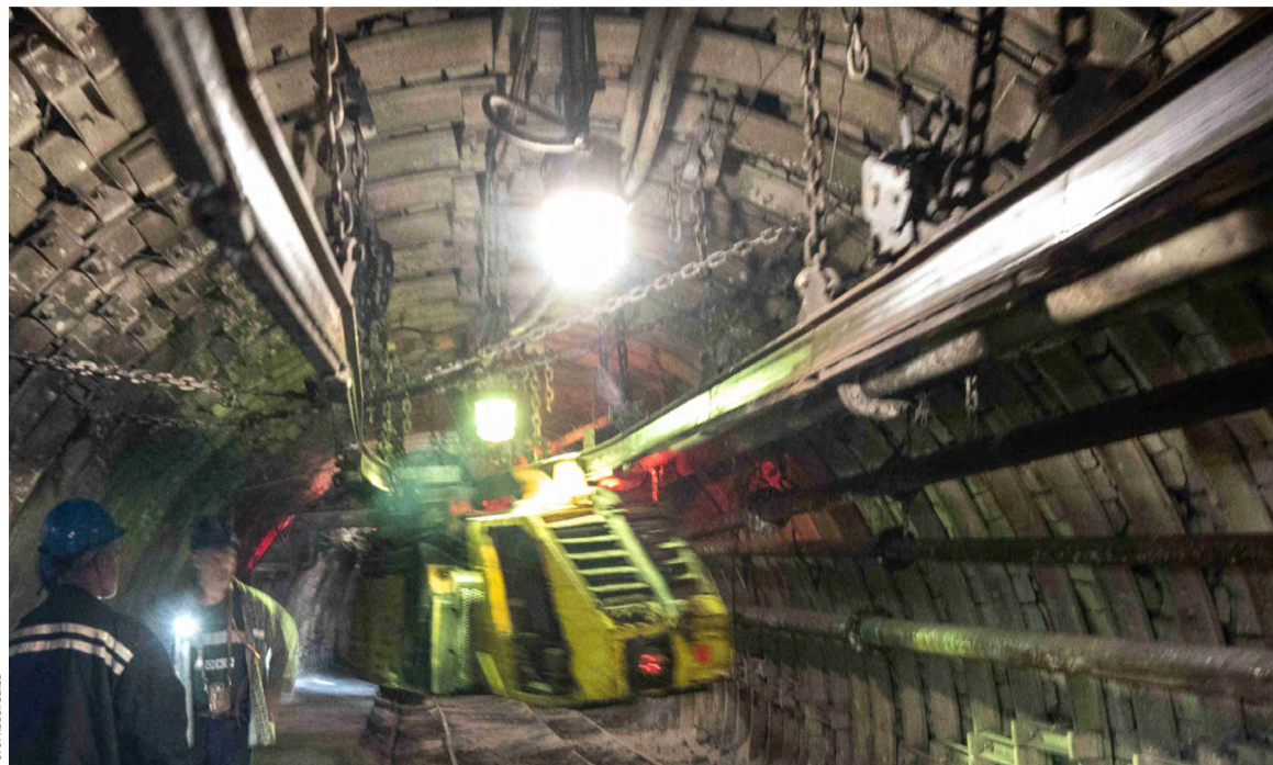
Severská centrální doprava byla odměněna za bezúrazovou práci v kategorii ostatních kolektivů.