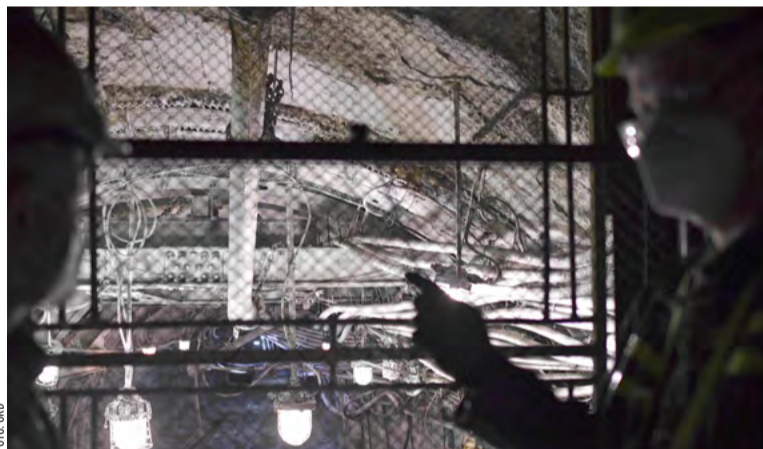
Poučení BOZP cílí na základní skupiny pracovních úrazů.