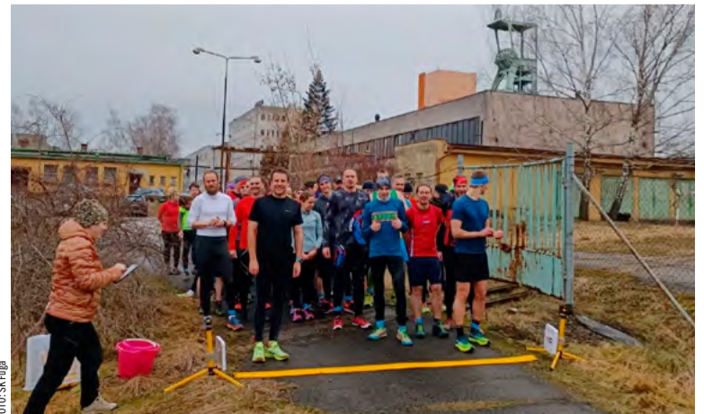
Start od jižní lokality stonavské šachty.

Dalším bude v sobotu 4. března Běh Dolem Pokrok v Petřvaldě se startem v 10 hodin od parkoviště na „Fučíku“. Na závěr celé série připravil oddíl SK Fuga Velikonoční dvanáctiminutovku. Toto finále se uskuteční v neděli 9. dubna od 10 hodin v Českém Těšíně na dráze atletického stadionu. Zde se budou získané body násobit dvakrát. Přihlásit se je možno na webu https://blog.skfuga.cz .