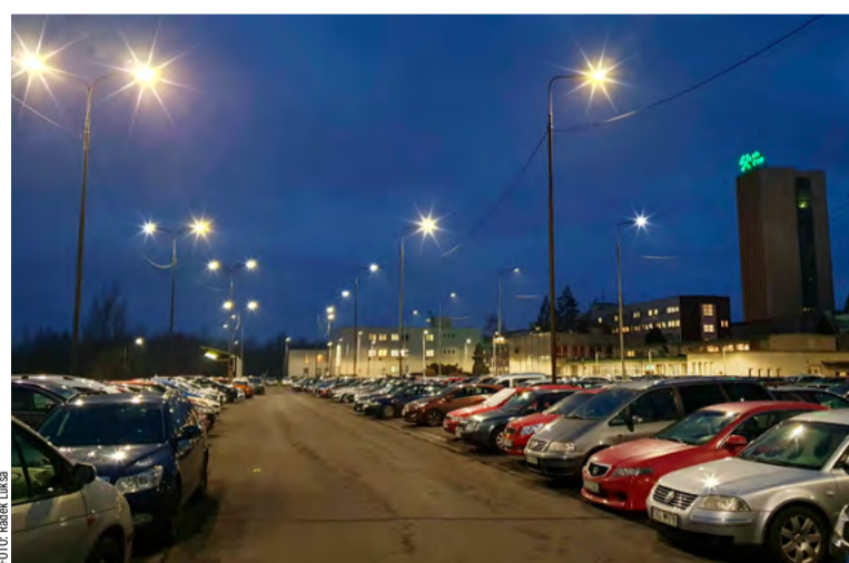
Nové LED osvětlení ušetří náklady na elektřinu.

Po procesu, který zahrnoval výběrové řízení, schválení technickou povrchovou komisí a výběr dodavatele s nejlepším poměrem cena – výkon, se na Dole ČSM instalovala první LED svítidla. „Na konci roku 2022 došlo k první etapě výměny těles na lokalitě Sever včetně Úpraven a na začátku letošního roku pokračuje výměna i na Jihu. I když se to nezdá, jedná se jen na Severu zhruba o 320 svítidel a na Jihu o 140,“ popisuje vedoucí elektrifikace povrchu s tím,