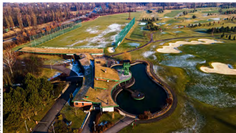
Jedenáctá sezóna byla na hřišti pod replikou těžní věže rekordní.

„Sezónu jsme odstartovali na letní jamky již 11. dubna seniorským turnajem. V minulém roce se na hřišti odehrálo 21 444 kol, což bylo více než předloni, kdy se odehrálo 21 077 kol,“ zhodnotil Malina. Na karvinském golfovém hřišti se konalo bezmála padesát akcí, od dámských golfových dnů, veřejných i klubových turnajů, úvodních lekcí golfu, až po dětské závody a příměstské tábory podporované opět Nadací OKD. Za vrchol sezóny vedoucí označil veřejný turnaj Lipiny Cup 2022. Posledním loňským turnajem se stal Texas Scramble Golf Resort Lipiny na konci října.