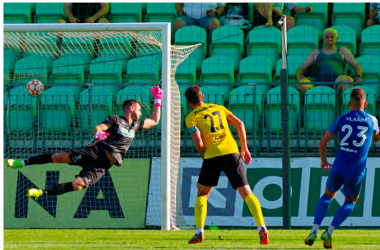
Karvinský fotbal funguje i za podpory OKD.