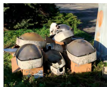
Výbojky, které dosloužily.

že výbojkové lampy už byly na hranici své životnosti.