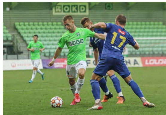
Zimní příprava je u konce a první březnový víkend se už hraje naostro.

týmem a řadou dorostenců. Do prvního mistrovského zápasu jsme šli v sestavě, která spolu neodehrála ani jedno přípravné utkání. Byl jsem v oče-