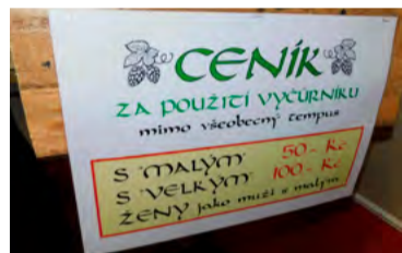
Opuštění sese za účelem úlevy na toaletě bylo zpoplatněno.

karmín a sílení se mastí počínaje, přes samotný skok přes kůži a soutěžení tablic konče. Hlavní cenu – But Starosty – získala ta Levá vedená kontráriem Janem Březinou.