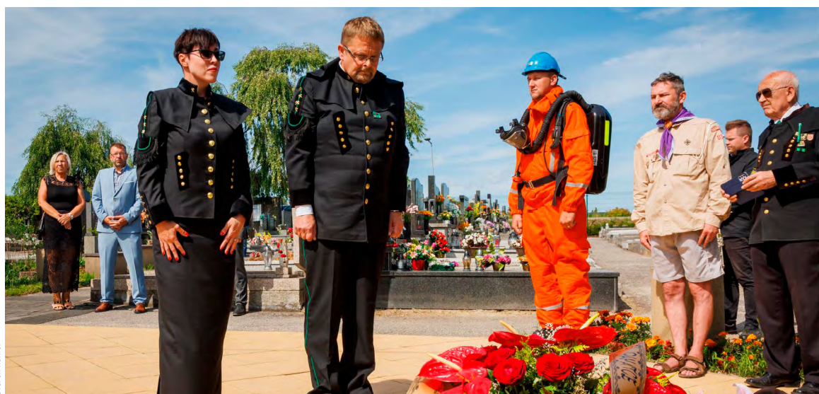
Tisková mluvčí a ředitel provozu u pomníku v Šumbarku.

Zdůraznil, že navzdory veškerému pokroku však hornické povolání zůstalo dřinou. „Vážím si našich zaměstnanců, kteří i přes tu tvrdou práci