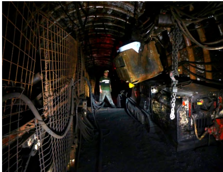
Při práci s mobilními stroji se zranilo na šachtě za první pololetí deset kolegů, polovina z úrazů spadla do kategorie registrovaných.