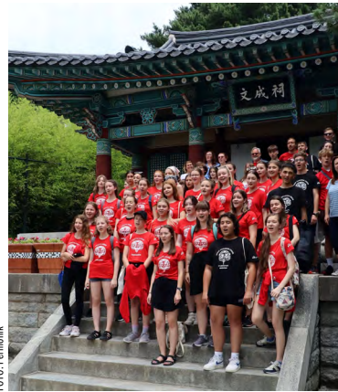
Karvinský pěvecký soubor Permoník sbíral ocenění v Koreji.

„Hry organizuje Nadace Interkultur pro amatérské sbory z celého