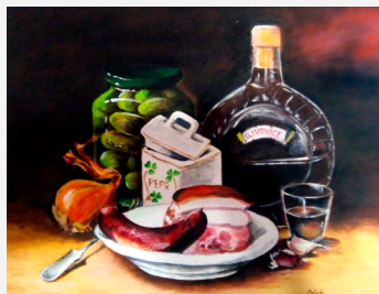
Tohle musí chlapa ze šachty oslovit.

„Kreslil a maloval jsem si odmalička. Že bych to zdědil po mamince?“ usmívá se Ocisk, který se amatérským umělcem stal někdy v čase vysokoškolských studií, samozřejmě na „báňské“ v Ostravě, odkud má inženýrský titul ze strojní a elektrotechnické fakulty. Na šachtě pracuje