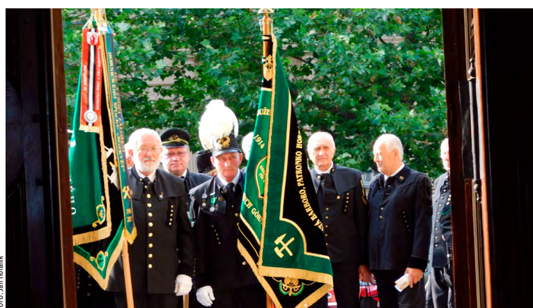
Hornické spolky v ostravské katedrále.

dea. Před bohoslužbou za živé i zemřelé havíře napochodovali do svato-stánku opět krojovaní horníci se svými prapory.