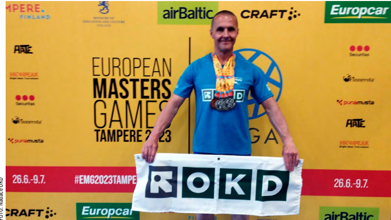
Rubáňový zámečník v Tampere ve Finsku.

Hracki bodoval, kde se dalo: 100 metrů prsa 3. místo (a osobák za 1 minutu a 23 sekund), 200 metrů prsa 2. místo, 50 metrů prsa 2. místo (další osobák za 35:25 sekund), 800 metrů kraul 2. místo, 400 metrů kraul 3. místo, štafeta kraul 2. místo a štafeta polohová 2. místo.