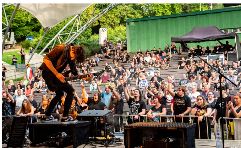
Orlovský festival Rocktherapy v letním kině.

Na scéně se objeví celkem sedm kapel, kromě Ahardu to budou Metal Factory, 100 na 100, Witch Hammer, Gate Crasher, Kreysen Memorial a Motorband. „V poslední grantové výzvě jsme oslovili Nadaci OKD a uspěli, jde do toho projektu s námi, za podporu v programu Pro region moc děkujeme,“ vzkazoval Jekí za organizační tým.