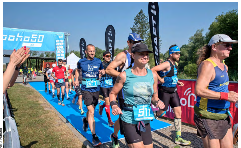
Start ultramaratonců na padesát kilometrů.

POHO50 už oznámila termín pro příští rok: Poběží se v neděli 23. června 2024.