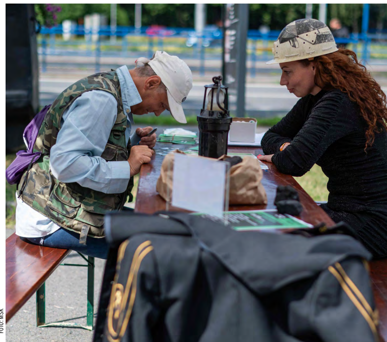
Fajront!!! na Jihu, upomínka na hornickou minulost.

OSTRAVA – Moravskoslezská metropole se sice stane dějištěm 27. Setkání hornických měst a obcí až od 8. do 10. září, ovšem její nejlidnatější městský obvod Jih už jedinečnou minulost začal připomínat v předstihu. Akce se jmenovala Fajront na Jihu a odehrávala se v sobotu 22. července.