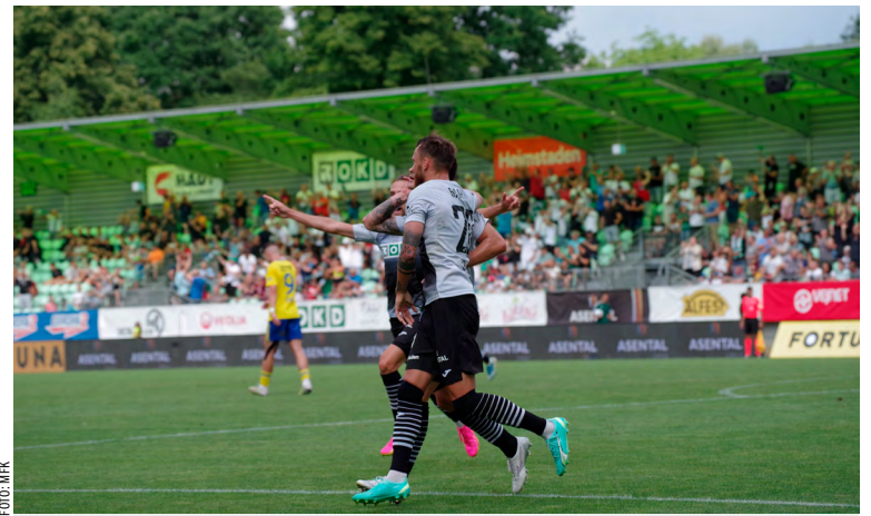
První vítězství v nejvyšší fotbalové soutěži pod logy OKD.