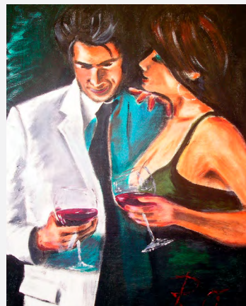
Vino je častým námětem tvorby.

„Tvořím pro své potěšení, případně pro přátele,“ dodává vedoucí povrchových provozů OKD s tím, že i jistí kolegové ze šachty už doma jeho obraz vystavený mají. Před malováním také někdy dostávají u Ociska přednost jeho další záliby: cyklistika a metalová hudba.